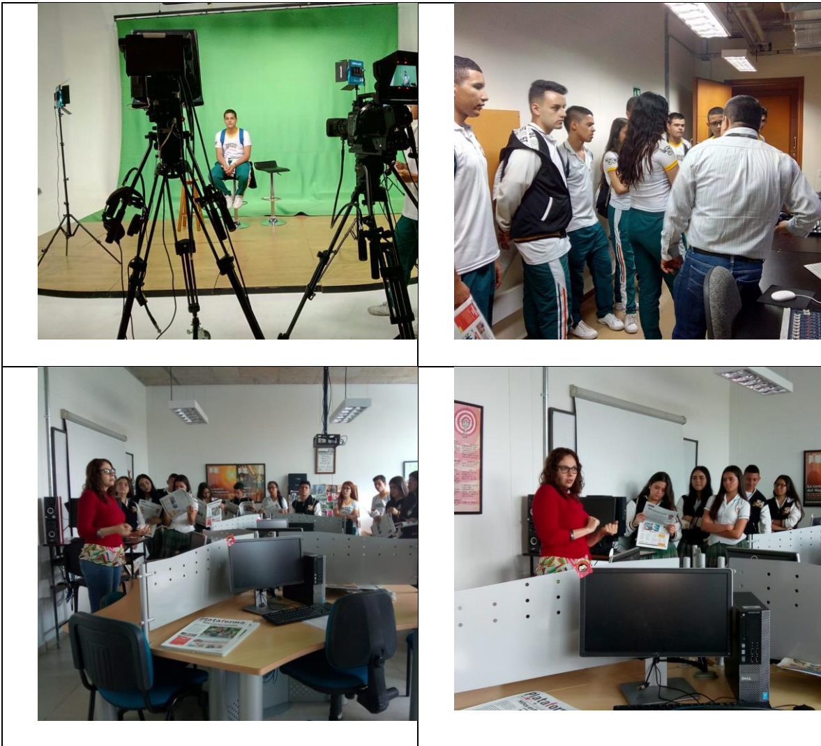
5Fotos visitas técnicas de colegios