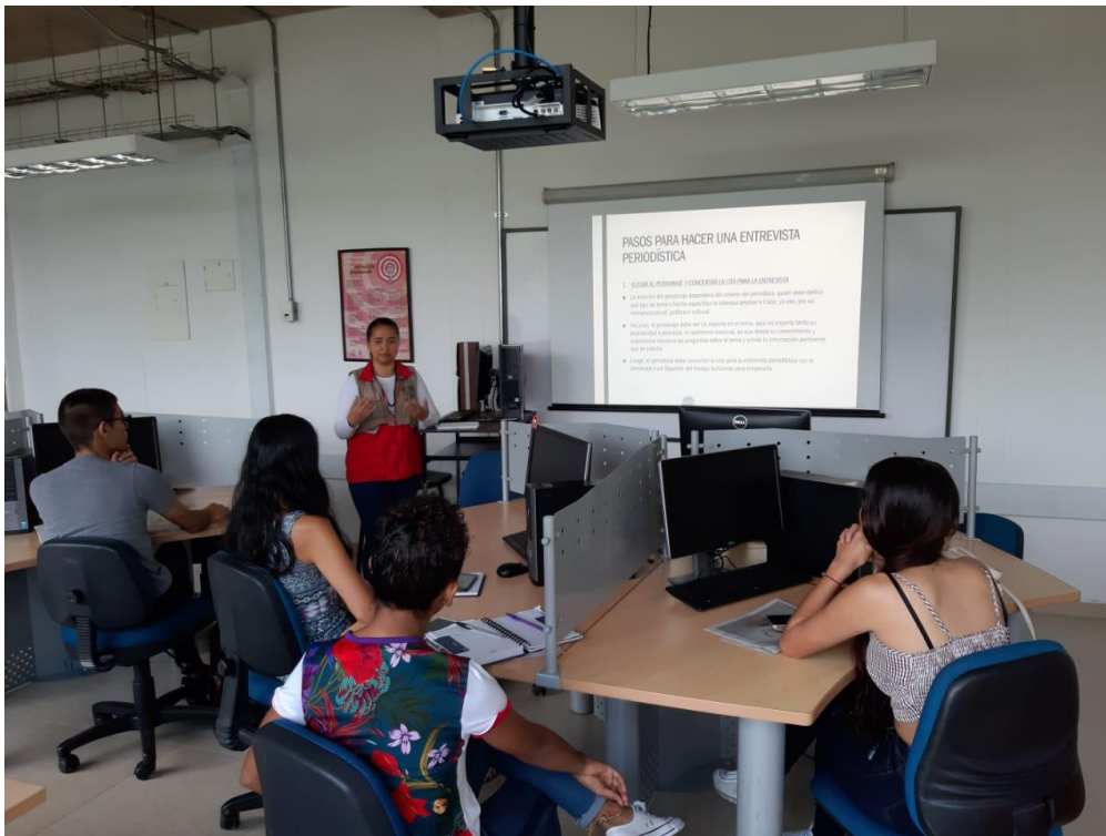
10Fotos de taller realizado por la pasante