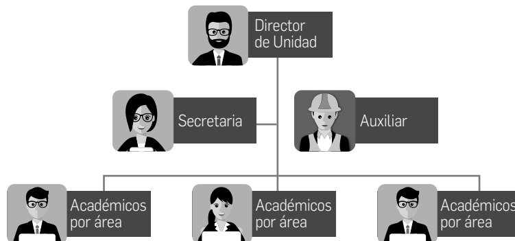
Figura 1. Estructura Organizacional Tipo

Es importante destacar entonces, que las unidades, responden al concepto de administración tradicional, de características verticales, con la rigidez propia de una administración pública y lo que esto conlleva. Si al actual organigrama agregamos una nueva función, ésta se encontrará en la estructura organizacional actual y se verá entrampada en todo el sistema administrativo indicado. Esto hace que realizar una investigación en una unidad académica sea una tarea que demanda un gasto de energía adicional, lo que indudablemente dificultará su éxito.