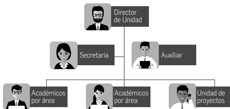
Figura 2. Modelo Propuesto de Estructura Organizacional

La unidad de proyectos, al disponer de sus propios recursos, podrá desarrollar todas sus actividades, rigiéndose por los procedimientos administrativos, establecidos para la universidad, pero sin interferir ni sobrecargar a la unidad académica propiamente tal.