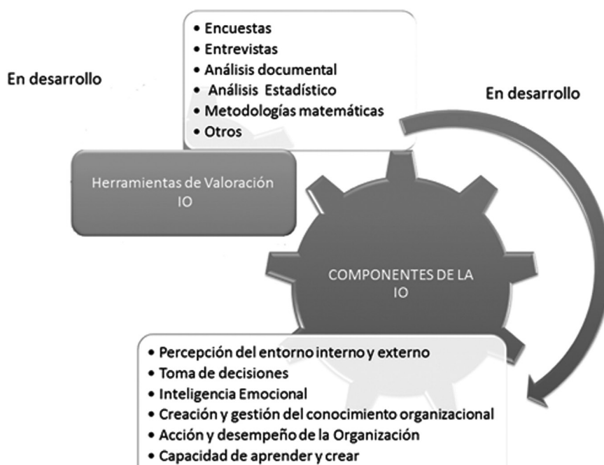
Gráfico 2. Algunos componentes y herramientas de valoración de la IO

Rizo, Benavides, Flebes y Estrada (2013) proponen y aplican una metodología matemática en el ámbito universitario para determinar si una organización tiene una gran IO, sobre la base teórica de las aportaciones de Senge (1990) y Marmota (1996). Por otro lado, Orozco (1999) emplea una valoración de los resultados de un análisis del estado del arte de la IO en relación con su presencia en la Consultoría Biomundi como centro de IO para la industria biofarmacéutica de la República de Cuba, teniendo como fuente los métodos de trabajo y la documentación de los resultados de la organización.