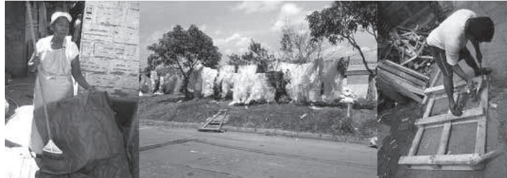
Figura 10. Proceso manual de limpieza del plástico. Secado del plástico luego de su limpieza en medio de la calle. Éste es un espacio compartido entre dos centros de reciclaje. Recuperación de madera sólo con la ayuda de un martillo. A pesar de esto, se espera que el proceso sea eficaz.