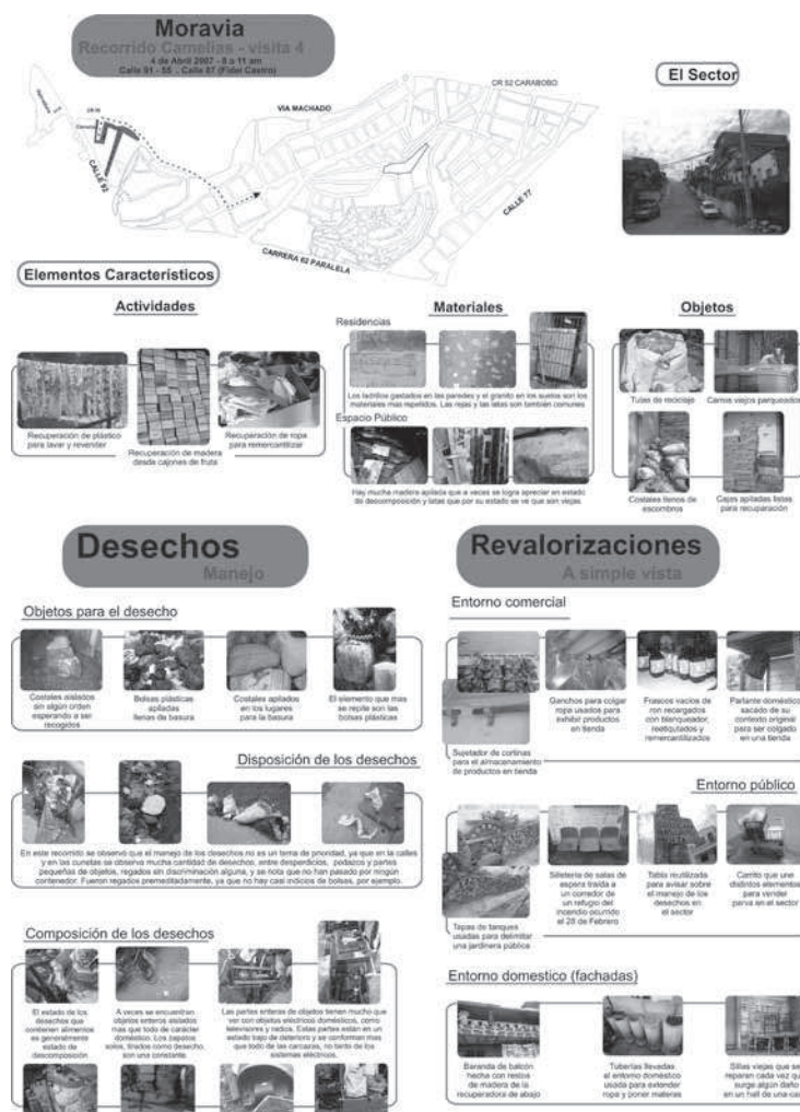
Figura 4. Ejemplo 1 de infograma.

El proceso de investigación estuvo compuesto por dos fases: una de observación exploratoria del fenómeno y otra de sistematización y clasificación de datos para un análisis posterior. En la primera fase se realizaron cinco visitas al barrio que se focalizaron principalmente en tres de los sectores (La Herradura, El Oasis y Las Camelias) que, según las primeras indagaciones en la población, eran los que más concentraban sus actividades en el reciclaje y la recuperación. En las visitas se demarcaban distintos recorridos por los entornos públicos para establecer rasgos diferenciadores entre los sectores. Se usó como guía un protocolo de registro de datos que delimitaba categorías de análisis, concernientes al manejo y la disposición de desechos dentro de los sectores, así como a las revalorizaciones halladas. Los resultados fueron plasmados a manera de infogramas que contenían la información más relevante de cada recorrido. A manera de ejemplo se ilustran dos de estos.