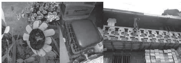
Figura 8. Materas hechas de botellas de gaseosa, pintadas a mano y vendidas por una habitante del barrio. Silla improvisada hecha de una canasta de gaseosas en des-uso y una almohada. Muro de madera hecho de material no comercializado del centro de recuperación de madera instalado en el primer piso.

El entorno de Moravia ofrece diversas posibilidades en cuanto a materiales, lo que delimita las formas de hacer y de re-inventar los procesos. La población toma lo que el entorno próximo le ofrece: recursos sencillos, fáciles de explotar y efectivos, que hablan de las realidades del barrio (materiales, objetos listos para re-contextualizar, técnicas de transformación). Por ejemplo, en las viviendas vecinas a los centros de recuperación de determinado material son notorios los arreglos o las intervenciones en fachadas e interiores de las casas hechos a partir del mismo. Esto plantea una estética que nos habla de la actividad que se realiza en el lugar y que también se ve reflejada en los objetos de uso cotidiano. Las actividades laborales, por otro lado, requieren condiciones específicas que se suplen con objetos y materiales facilitados por el entorno. En la Figura 8 se muestra cómo una canasta vacía de gaseosas ofrece la altura necesaria para acceder a costales llenos de botellas de aguardiente que están a la espera de ser despiezadas. Como se puede observar, la cercanía de las personas a objetos y materiales de desecho convierte a estos últimos en materia prima fácil de obtener, sin tener que ir muy lejos del lugar donde se habita o labora.