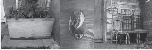
Figura 1. Matera hecha con madera recuperada. Materas hechas con bombillas en des-uso. Sillas recuperadas de cerros de basura, limpiadas y re-pintadas.