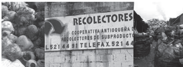
Figura 7. Hay muchos materiales que son tomados para ser recuperados, incluso si no tienen un uso concreto. En la imagen aparecen costales de basura en un centro de reciclaje que llegan de diferentes sitios de la ciudad.