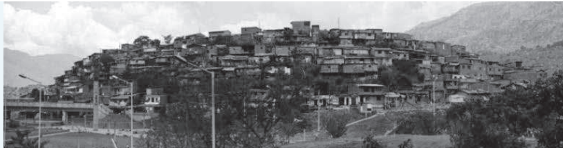
Figura 2. Moravia "El Morro" – 2003.