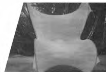
Modelos de las sillas