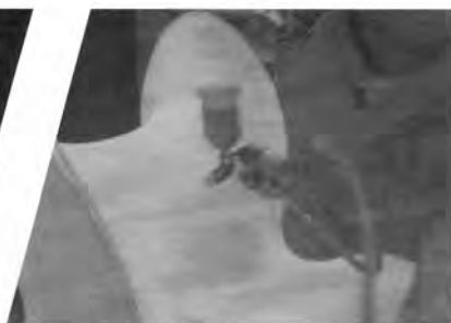
Aplicación de la Resina de Poliéster para rigidizar la tela