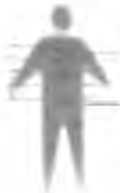
|"Medecines chroniques" Imág. 8 | Pierre di Sciullo / (2001)

La miniaturización electrónica empezó en 1959 con el desarrollo de los circuitos integrados. Estos dispositivos consistían en conjuntos de transistores interconectados en una pequeña pastilla de silicio llamada "chip". A este pequeño dispositivo le debemos casi todas las aplicaciones electrónicas que conocemos hoy, ya que gracias a él, las computadoras empezaron a tener menor costo y sobre todo a