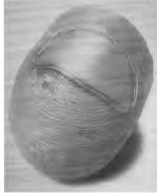
"Tim Hawkinson" Imag. 5 Hallan Smith Design Inc. / (2000)

sucesión y no de la imagen estática. Además estas imágenes son cada vez más complejas. Pretenden decir más en menos tiempo. Por ejemplo en la serie de FOX "24", las viñetas de las historietas animadas o en la película Lola Corre Lola de Tom Tykwer (1998) el marco de la pantalla se divide en tres o cuatro secciones, con imágenes simultáneas pero que provienen de diferentes lugares. Otro ejemplo es el uso cada vez más popularizado de la esquemática 2 como lenguaje, donde se reúnen texto e imagen para que puedan ser leídos en diferentes órdenes o profundidades.