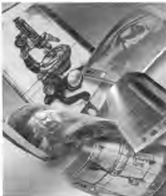
Imag. 10 | La evolución mediatizada http://www.philips.com