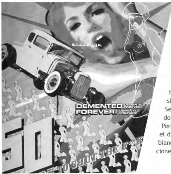
"Demented Forever Series" Imag. 7 buro fur form / (2001)

Sin embargo, la imagen visual que se creía la más unívoca de las percepciones empieza a perder terreno a manos de otros sentidos que pueden no ser tan precisos pero nos permiten una mirada más holística de la realidad.