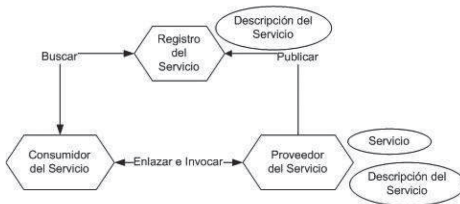
Fig. 1. Representación de la metodología correspondiente a SOA basados en el paradigma de Encontrar, Enlazar e Invocar [2].

El avance en sistemas orientados sobre SOA ha llevado a sumarse a la interconexión de varias plataformas de empresas diferentes pero con intereses compartidos con el fin de mantener una conexión constante entre ellas garantizando la mayor cantidad de información actualizada. Este proceso de intercambio requiere de un lenguaje estandarizado con el fin de conservar un modelo de bajo acoplamiento y fácil interacción. XML es empleado como la estructura de formateo de los archivos que se cruzan entre los servicios por manejar un buen nivel de seguridad y ser interpretado por la mayoría de los lenguajes de programación empleados en SOA con unos niveles de personalización flexibles para los desarrolladores según las necesidades de su aplicación [3].