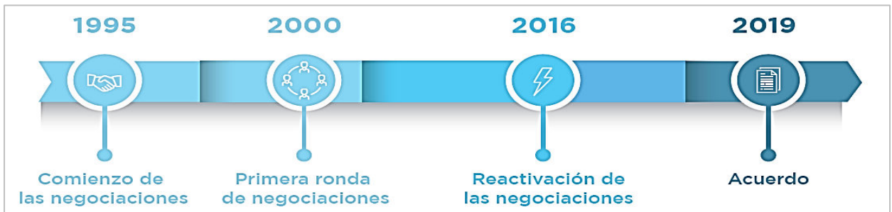
Figura 1: Historia de las negociaciones (MERCOSUR, 2019)

El tratado, firmado finalmente el 28 de junio de 2019 en la cumbre del G20 en Japón fue anunciado como un hito en el conjunto de los TLC a nivel mundial especialmente en el contexto histórico actual. Tiempos en los cuales están surgiendo nuevamente tendencias proteccionistas, separatistas y muy nacionalistas también en el ámbito económico. Tanto los representantes de la UE como del MERCOSUR (Brasil, Argentina, Uruguay, Paraguay) se refieren a la firma de este tratado como un hecho “histórico” y de grandes dimensiones (European Commission, 2019d; MERCOSUR, 2019b). Esta clasificación se debe sobre todo al largo proceso de negociaciones previo a la firma del acuerdo. Como se refleja en el siguiente gráfico, fueron más de veinte años los que se necesitaron para que las ideas, principios y valores de dicho acuerdo pudieran consolidarse por medio de un tratado firmado por las partes.