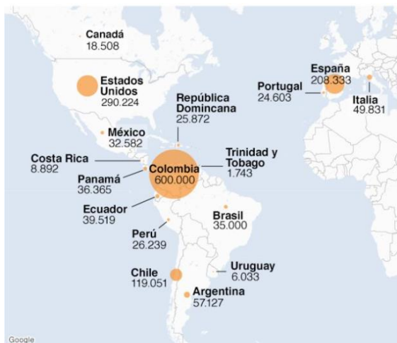
Ilustración 1. Número de Migrantes Venezolanos en sus Principales Destinos en 2017.

*La cifra del número de migrantes no captura a aquellos que están en situación irregular o en tránsito.