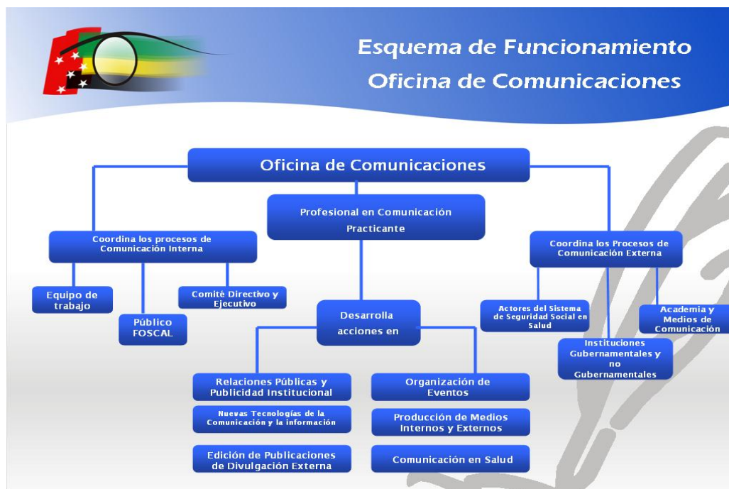
Figura 1 5

públicas, e implementar estrategias de comunicación en salud para apoyar el contenido de las publicaciones 4 .