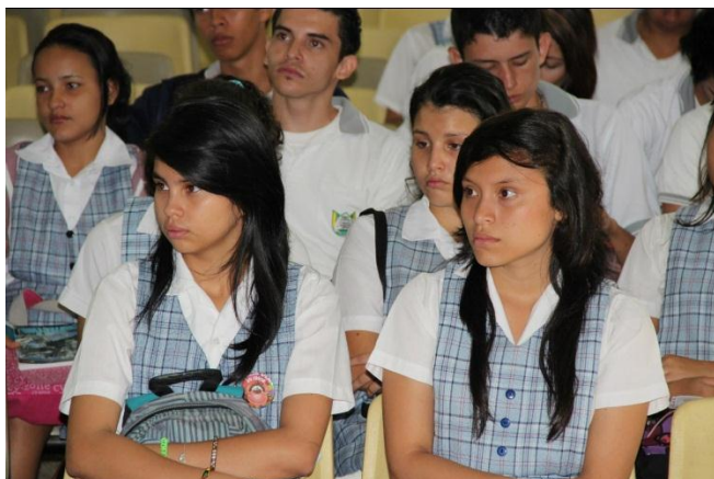
Fotografía de estudiantes de décimo grado en la sustentación del proyecto en el auditorio mayor del colegio INEM