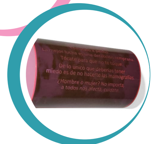
Fácil instalación y encendido a 120 voltios. Bombilla intercambiable.