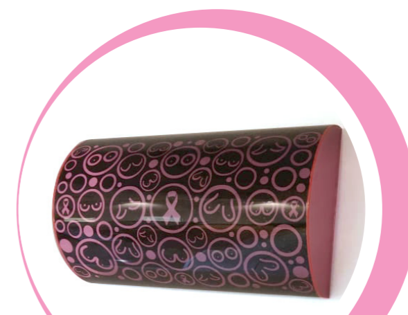
PROYECTOR DE FORMAS

Sugerimos, que el/la profesional en radiología, maneje un tono de voz suave y apague la luz del espacio de sala de mamografía.