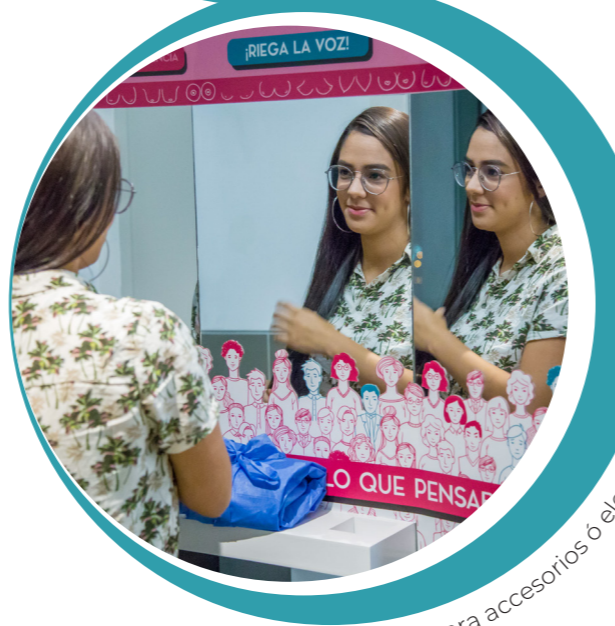
Bandeja para accesorios ó elementos metálicos.

INGRESO A LA SALA DE MAMOGRAFÍA: PANEL EDUCATIVO