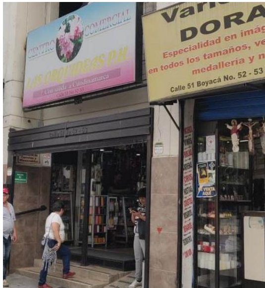
Figura 3. Fotografía de almacenes donde se venden productos esotéricos

Por otro lado, el alcance geográfico de la investigación es el Barrio Calasanz de la ciudad de Medellín ya que es considerado un barrio tradicional. Calasanz (ver figura 4) está ubicado en el viejo hipódromo San Bernardo en el sector occidental de la ciudad, y ha sido catalogado tradicionalmente como un barrio de “gente acomodada” que ha permanecido allí por décadas y que hoy se constituye como un barrio viejo, dado que su población es mayoritariamente de la tercera edad. Esta condición le confiere a este lugar una característica fundamental para el proyecto y es encontrar diferentes generaciones en un mismo espacio para poner en evidencia si una práctica continúa estando presente o desaparecen conociendo ciertas prácticas objetos o rituales que han sido transmitidos por generaciones y que hoy en día puede que hayan pasado dicho conocimiento a otras generaciones o que de lo contrario con experiencias no satisfactorias hayan olvidado dichas estas prácticas, rituales u objetos.