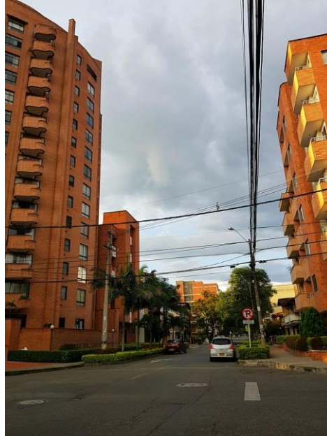
Figura 4. Fotografía de una calle del barrio Calasanz

A partir de la investigación y la recolección de datos realizadas se desarrolló una matriz de hallazgos en la cual se introdujo la información recibida por 17 personas entrevistadas la matriz tiene como variables, los agujeros de tipo económico encontrados que se disponen como un objeto portable (ver tabla 1), para guardar en privado (ver tabla 2), para exhibir en espacios o prácticas y rituales (ver tabla 3 y 4). Y está dividida en personas menores de 60 años y personas mayores de 60 años. Como información recolectada se obtuvo que el 50% de los jóvenes y el 50% de los adultos no creen en agujeros y que el 40% de los jóvenes no cree en la religión, también se halló que los jóvenes conocían menos cantidad de prácticas, ritos u objetos. Esta matriz fue una herramienta efectiva para la recolección de información acerca de dichas prácticas, ritos u objetos que la cultura género, y que por ciertas razones las personas acogieron por generaciones o simplemente olvidaron y aparecieron otras (ver tablas 5 y 6)