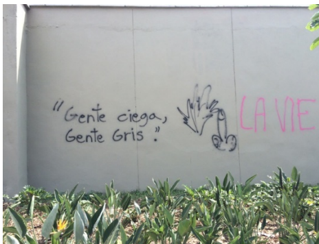
FIG 5 Y 6