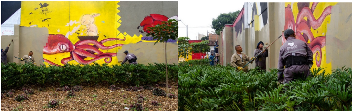
FIG 3 Y 4

Hoy los murales han vuelto a aparecer tímidamente en la carrera 43, cubriendo los insultos y los genitales, desordenados sobre el muro gris van surgiendo espontáneamente grafitis que siguen dándole a la vía una impresión más vandálica que artística.