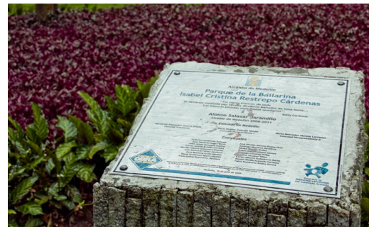
FIG 9 Y 10