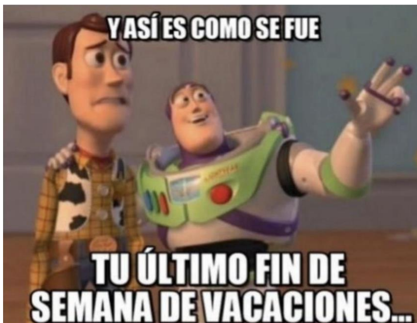
Fig. 2. Heraldo. Memes para alumnos, profesores y padres... ¡para sobrevivir a la vuelta al cole! (septiembre, 2019)

Aquí se pueden estudiar grupos de palabras, por ejemplo, explicarles que “se fue” está en pasado y se puede usar para un hombre, una mujer, un animal o una cosa. Esto se debe