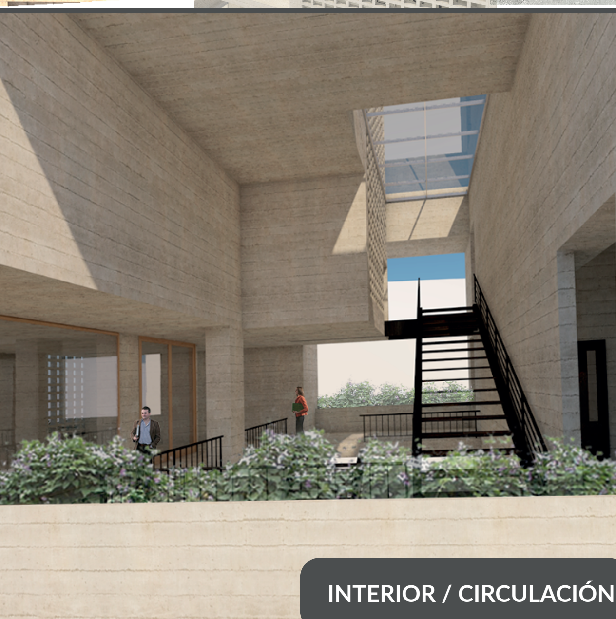
INTERIOR / CIRCULACIÓN