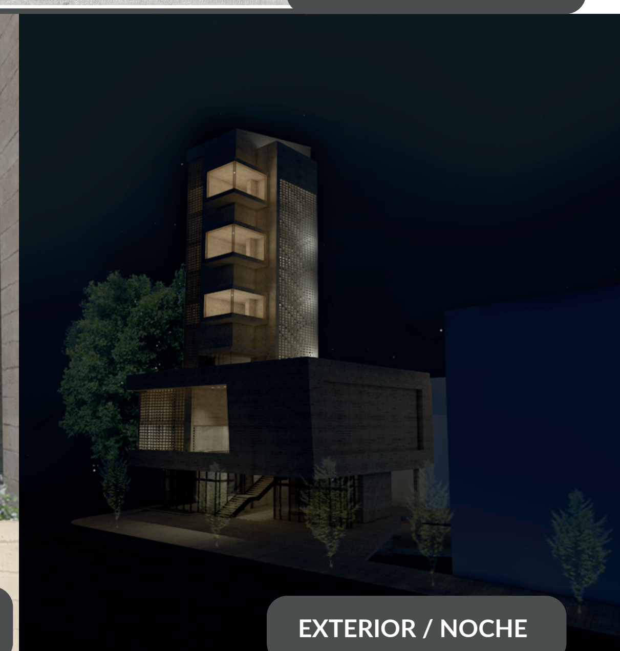
EXTERIOR / NOCHE