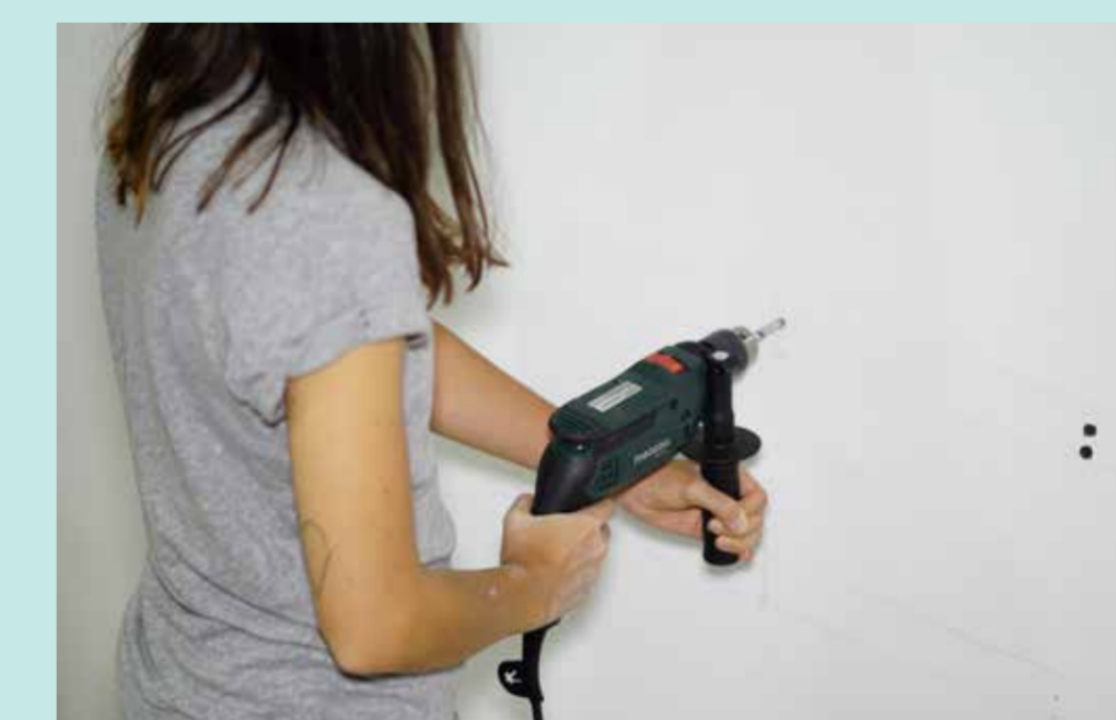
Instalacion con barras de tiro y del sistema