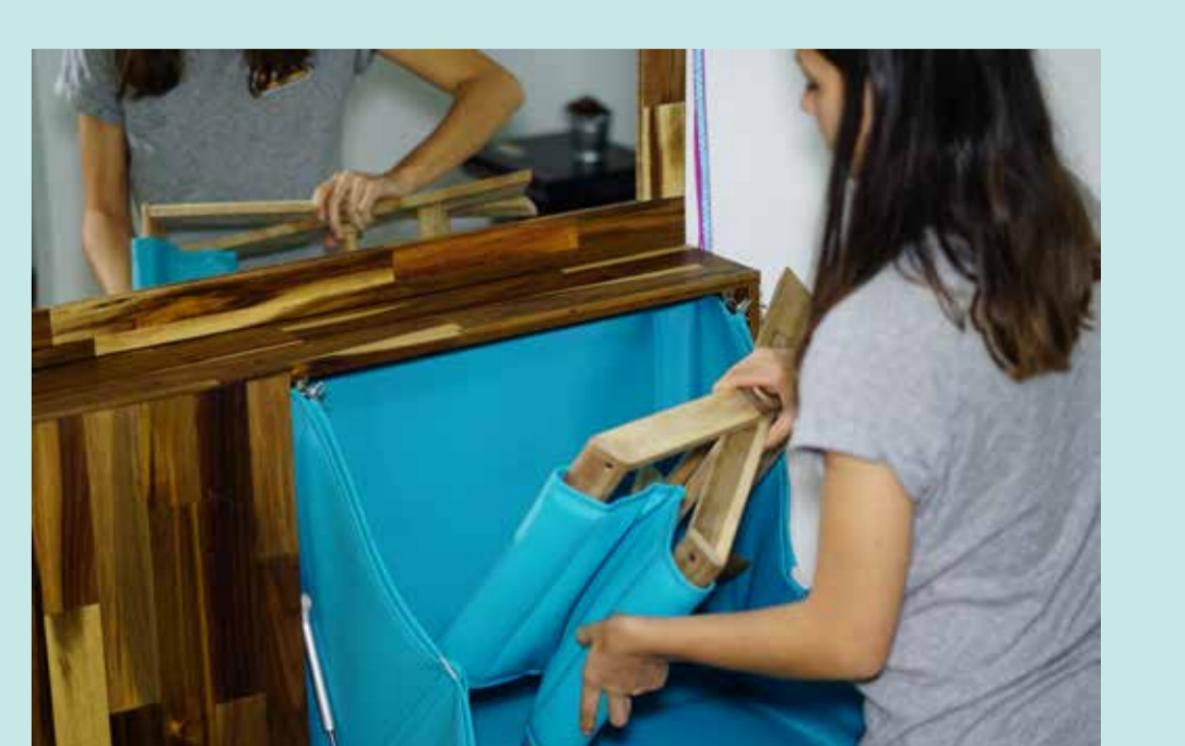
Asiento guardado en el interior