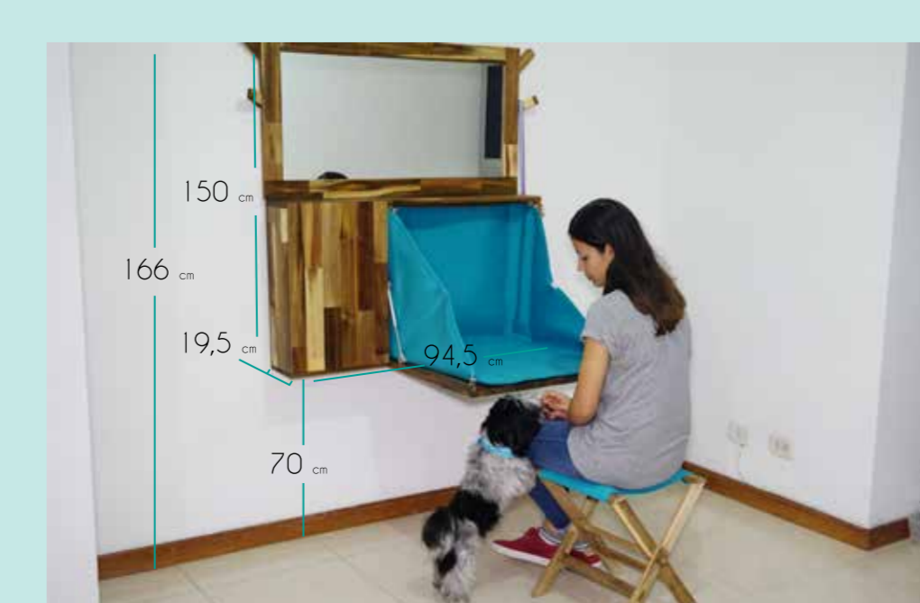
Pensado para espacios de transición y áreas sociales del hogar.