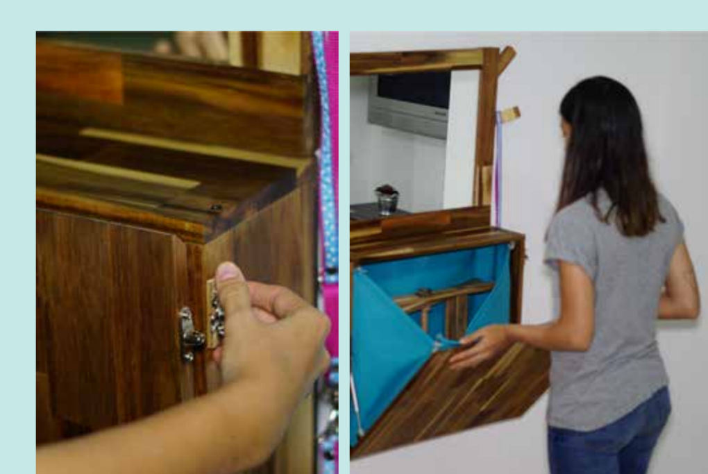
Apertura del sistema