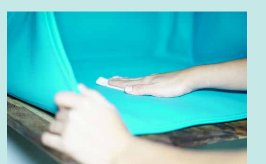
Facil de limpiar, resistente a la humedad y los rasguños.