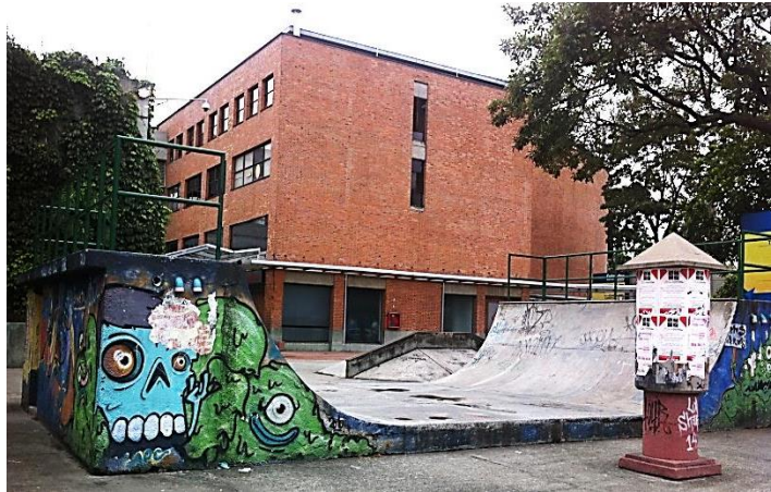
Zona de skate-terminal del sur de Medellín, 2014

El segundo espacio analizado, es la Terminal del Sur y su zona de skate; un lugar donde han ocurrido múltiples evoluciones tanto de infraestructura como en el comportamiento de quienes de una u otra forma lo frecuentan.