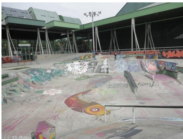
Zona skate y elementos que complementan la rampa - terminal del sur de Medellín, 2014

A nivel de infraestructura, las evoluciones han sido: desgastes en el mobiliario, intervenciones gráficas en paredes y muros; además, de las adecuaciones que se han visto obligados a realizar ciertos locales, como rejas de chuzos en la parte inferior de las ventanas, evitando así que los visitantes se sienten allí.