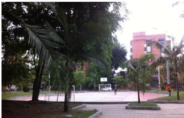
Cancha del parque de san Joaquín, 2014.

Posterior a un trabajo de campo realizado durante 5 semanas, en el cual se tomó como base la experiencia de vecinos, deportistas y transeúntes de la zona, se pudo encontrar puntos focales de partida.