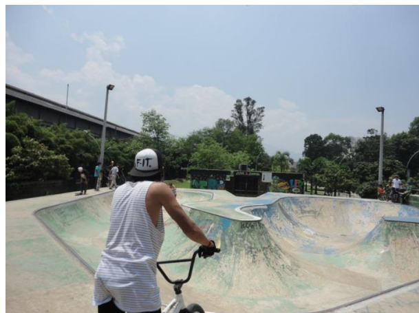
Bowl de skate en el parque lineal Ciudad del Río, 2014

La presencia del vicio, la droga, el alcohol y las muestras de afecto de las parejas homosexuales, es un factor determinante que se presenta de manera negativa, afectando moralmente a quienes no tienen contacto directo con la zona deportiva como tal.