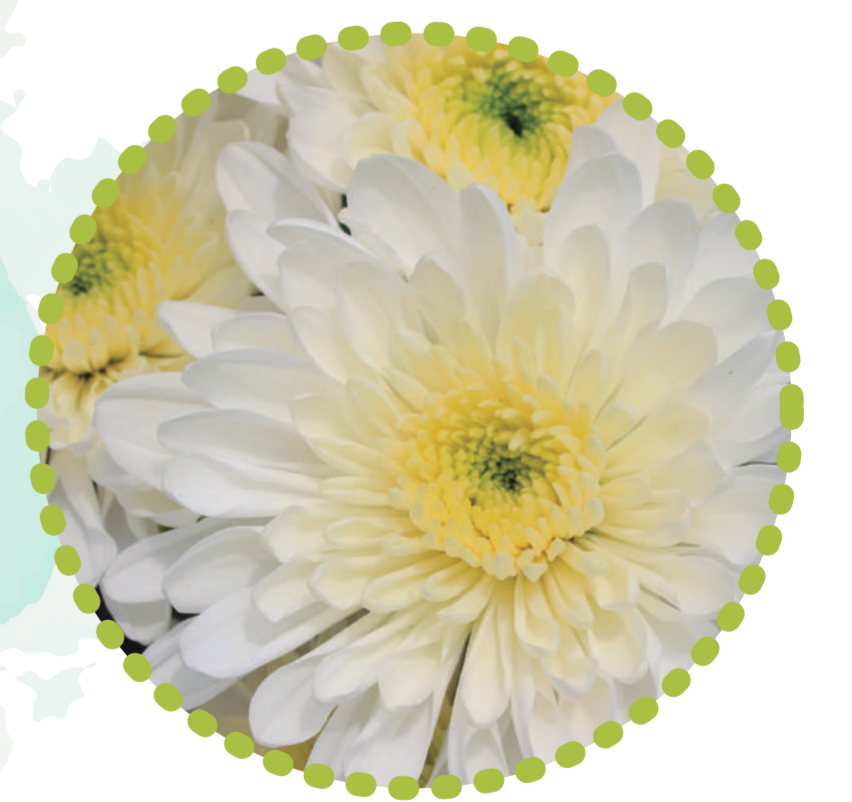
Crisantemo Arctic Queen