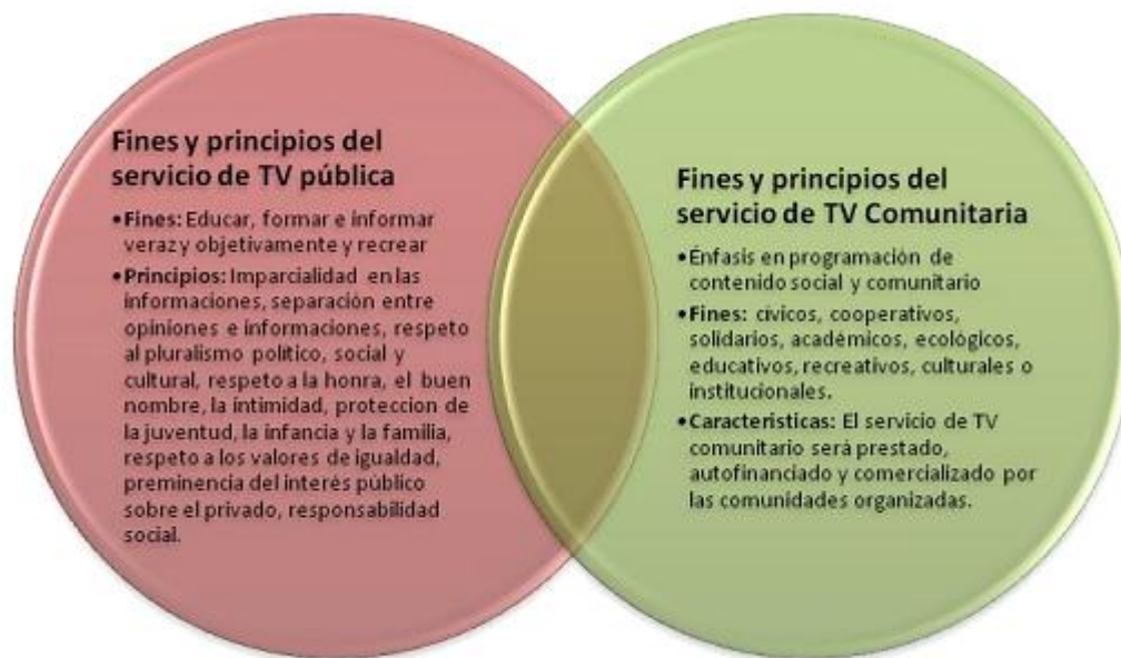
Gráfica 1: Fines y principios del servicio de televisión pública y del servicio de televisión comunitaria.

Nacionalmente existen las reglas para cumplir con requisitos impuestos y montar o producir un canal comunitario, en la cual la ANTV describe los fines, principios y servicios de la televisión pública, plasmados en la siguiente gráfica.