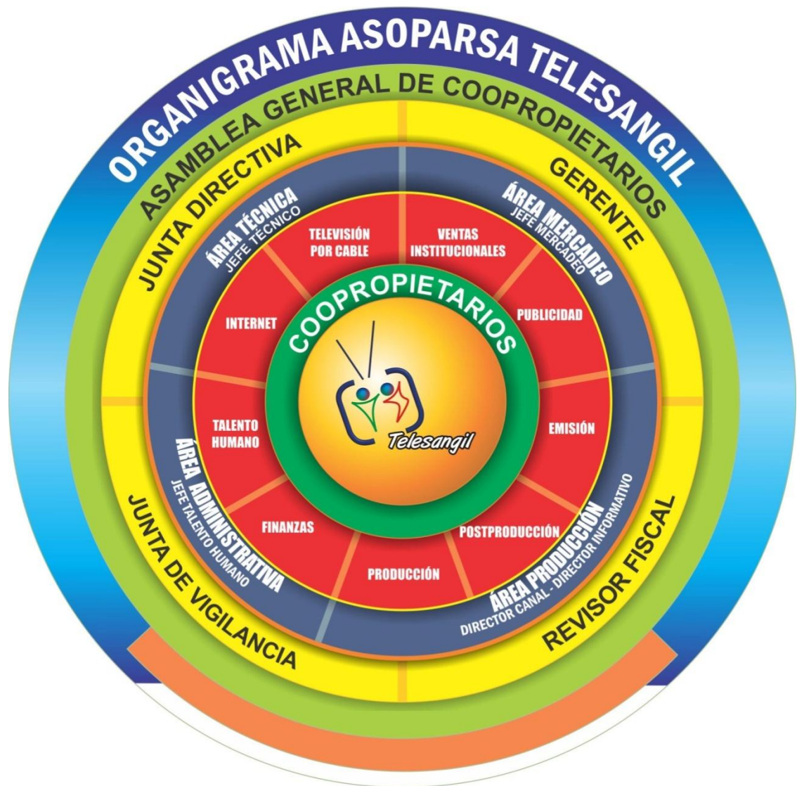
Figura 3. Organigrama Asoparsa- Telesangil.