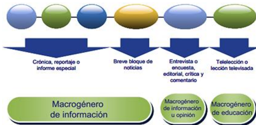
Figura 2: Estructura de los bloques informativos de un noticiero comunitario.

En la siguiente figura Lizandro Rincón describe la estructura de un informativo, los géneros periodísticos y la temática con más interés, teniendo en cuenta que lo más característico son reportaje, crónica y opinión, aplicándolo en la misma comunidad para comunicarlo.