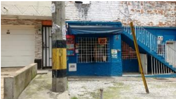
Figura 10, en esta imagen se puede ver el uso de una venta con reja como materialización de un punto de contacto que a su vez adopta una barrera o límite entre las personas adentro y afuera de la vivienda.

e importante dentro de las casa-negocio que es la de barreras, límites y separadores , elementos muy utilizados dentro de esta tipología espacial y que tienen gran influencia y permiten hacer una mejor lectura de las relaciones humanas justificadas desde la proxemia en estos lugares.