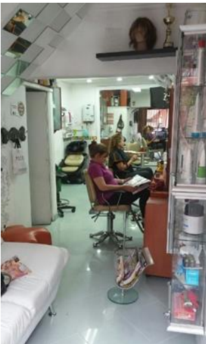
Figura 13, Esta peluquería en La Merced (Belén) funciona para ejemplificar el contraste con la imagen anterior, ya que este local responde a características más comerciales reflejadas tanto desde el mobiliario y los objetos que utiliza como desde la estética que denotan el tipo de baldosa utilizada en el piso, los espejos distribuidos en el local y las dimensiones de estos, y el acercamiento a una identidad de marca que evidencia de cierta manera unos elementos muy utilizados por las peluquerías “profesionales” como lo son los colores y los materiales utilizados.

Al implementar la estética comercial suelen hacerse cambios como: cambiar los pisos, pintar paredes, cambiar mobiliario, implementar un uso de colores, materiales y una especie de identidad de marca relacionada con el negocio, y que va un poco más allá (en algunos casos) del gusto personal de sus propietarios.