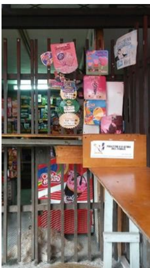
Figura 14, en esta imagen logramos ver como se instalo una reja que no solo impide la entrada de desconocidos sino que evita que la mascota en este caso un perro salga de la casa.

las rejas, que son instaladas generalmente para sugerir un distanciamiento pre-programado principalmente por seguridad, tanto para cuidar de sus bienes materiales y productos ante cualquier descuido o percance, pero a su vez también para evitar incidentes que se podrían generar al estar abierto la mayoría del tiempo, con seres que no cuentan con una autonomía y/o capacidad de decisión asertiva como lo son los niños pequeños y los animales.