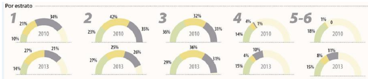
Figura 3 (Esquema de porcentajes por estrato de preferencia hacia los mercados/ brandstrat 2013)

Colombia es uno de los países donde la cultura de la tienda aun permanece a pesar del arribo de las grandes superficies comerciales. Basados en esto y en lo dicho anteriormente, pudimos entonces ratificar que la casa–negocio, es un campo muy amplio para llevar a cabo una investigación, donde reside una gran cantidad de información acerca de la cultura material dentro del contexto colombiano, ya que evoluciona con las características de la sociedad. Esto se puede evidenciar por ejemplo en los café internet, que en estudios de años anteriores se encontraban dentro de los tipos de casa-negocio más comunes y que han decaído casi hasta su desaparición. Por lo tanto, dicho tipo de lugar que responde tanto para una vivienda como para un modelo de negocio, nos brinda sitios donde han ocurrido y se encuentran miles de cosas para llevar a cabo una investigación, que brinde características reales de una cultura actual. Resultado de una coevolución a través del tiempo, y simultáneamente enfocando todo esto al campo del diseño industrial.