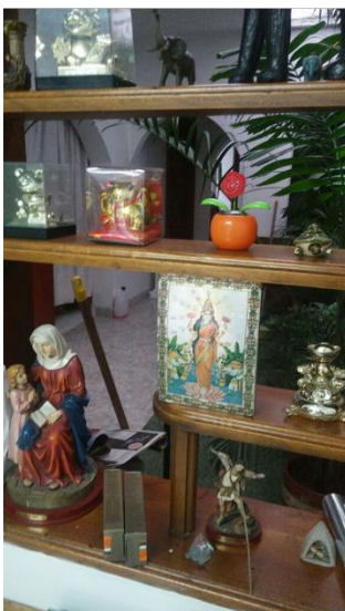
Figura 8, en esta imagen se logra ver una estantería de una peluquería varios objetos con connotaciones simbólicas de diferentes religiones y culturas.

No obstante y como un punto en común dentro de las casa-negocio, es la resistencia que existe a mostrar otros aspectos íntimos del hogar como fotos familiares, pero la libertad con la que estos sitios expresan sus creencias mediante emblemas y objetos relacionados con cada una de sus ideologías religiosas, desde este punto, es muy interesante el observar cómo se puede encontrar una nebulosa místico esotérica, la cual se refiere a la mezcla y migración de símbolos religiosos a occidente, utilizados muchas veces sin una finalidad religiosa muy específica; hallazgo que devela aspectos relacionados con la protección de algunos factores que pueden resultar íntimos, ya que, en casi todas las casa-negocio que se visitaron se encontraron una buena cantidad de signos religiosos, pero nunca una foto de la familia, o cosas de la casa, así pues, observando en que tan permisivos se muestran las personas dentro de la casa, que muestran sus creencias o ponen símbolos cuyo significado se relaciona a sensaciones que quieren sentir, pero nunca muestran fotos familiares o asuntos dentro de la familia.