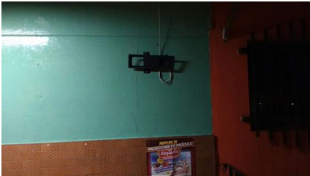
Figura 7, en esta imagen se puede ver una base/estructura para televisores puesta al exterior de una tienda de barrio, con la finalidad de acoger un televisor que su ubica en determinadas ocasiones en dicho lugar para el entretenimiento de los clientes.

No obstante y como un punto en común dentro de las casa-negocio, es la resistencia que existe a mostrar otros aspectos íntimos del hogar como fotos familiares, pero la libertad con la que estos sitios expresan sus creencias mediante emblemas y objetos relacionados con cada una de sus ideologías religiosas, desde este punto, es muy interesante el observar cómo se puede encontrar una nebulosa místico esotérica, la cual se refiere a la mezcla y migración de símbolos religiosos a occidente, utilizados muchas veces sin una finalidad religiosa muy específica; hallazgo que devela aspectos relacionados con la protección de algunos factores que pueden resultar íntimos, ya que, en casi todas las casa-negocio que se visitaron se encontraron una buena cantidad de signos religiosos, pero nunca una foto de la familia, o cosas de la casa, así pues, observando en que tan permisivos se muestran las personas dentro de la casa, que muestran sus creencias o ponen símbolos cuyo significado se relaciona a sensaciones que quieren sentir, pero nunca muestran fotos familiares o asuntos dentro de la familia.