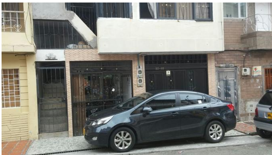
Figura 12, en la fachada de esta peluquería se puede visualizar que las escaleras que permitían el acceso a las casas en los diferentes pisos estaban dispuestas de una manera en sus inicios, pero al implementar el negocio en la vivienda del primer piso hubo un cambio ya que como se ve las escaleras del primer al segundo piso tienen una orientación perpendicular a la fachada permitiendo la ubicación en la fachada del negocio, caso que no sería efectivo si se hubieran dejado las escaleras originales.

que se encuentra comúnmente es la de modificar los espacios para ventanas y puertas, generalmente con fines de ampliación, modificación que se utiliza como recurso para que desde el espacio público se evidencie fácilmente los productos y servicios que ofrece dicho lugar; intervenir los muros en la fachada para crear nuevos puntos de contacto con el público es otra de las mutaciones frecuentes, esta muchas veces se complementa con otros de los ítems mencionados anteriormente.