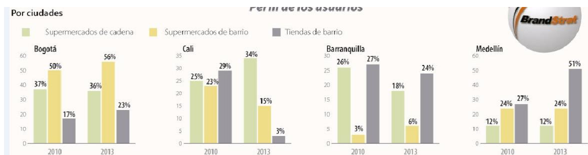
Figura 1 (Esquema de porcentajes de preferencia de modelo de negocio por ciudad/ Brandstrat 2013)

La casa–negocio es una superficie comercial que solía ser rentable y común en el país e incluso a nivel latinoamericano. Medellín es una ciudad idónea para investigar la casa–negocio, ya que es uno de los pocos lugares donde la importancia, popularidad y rentabilidad de estas se mantiene, a causa de que es la segunda ciudad en Colombia con mayor número de este tipo de establecimientos, y en la que sus habitantes tienen mayor tendencia y preferencia a acudir a dichos lugares a nivel nacional, logrando mantener gran parte de la torta del mercado, que en otras ciudades ha sido desplazada por modelos de negocio como los supermercados y otros establecimientos netamente comerciales. Medellín se encuentra emplazado en el primer puesto a nivel nacional en aceptación y utilización de los servicios que prestan estos lugares, por lo tanto, cuentan en proporción con mayor cantidad de consumidores con respecto a la población total de la ciudad ( Véase figura 1 ).