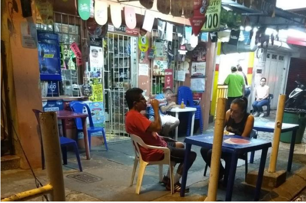
Figura 6, espacio a las afueras del local, el cual presta espacios para la estadía y la socialización, como se evidencia en la foto.

Desde ese primer momento en que se llega se está en contacto con una de las personas que hace parte de la casa, es a estas a quienes se les pide los productos, lo que puede llevar a tener una conversación (que puede ser acerca de algo que no tenga que ver con la venta) o a un acercamiento más íntimo, a diferencia de cuando se llega a un gran supermercado y se va directo a la compra de los productos. Hay pues un sentido en ese ir a los productos de primera mano, la función de la cajera es prestar un servicio meramente de recibir dinero, no es acompañar al cliente durante toda la actividad comercial como en las tiendas de barrio, todo esto gracias al entorno donde se desenvuelve la actividad comercial.