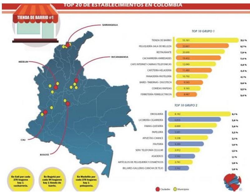
Figura 2. Top 20 establecimientos

Basados en el estudio de Infocomercio realizado cada dos años por la firma Servinformación, la cual sirve de hoja de ruta para los comerciantes colombianos, en donde se encargan de estudiar las nombradas por ellos como las 5 grandes ciudades del país. Podemos afirmar según los datos que arrojó el análisis del año 2017 (ver figura 2) que las tiendas de barrio ocupan un 21% del total de negocios comerciales a nivel nacional actualmente y el 16,9% del comercio en Medellín, lo que se traduce en una (1) tienda de barrio por cada 683 habitantes de la ciudad. La “tienda” no es el único servicio que prestan las casa–negocio encontradas en la ciudad, también se encuentran: salones de belleza los cuales ocupan el 6,85 %, restaurantes de tipo “corrientazo” el 5,9% y también entran en el listado papelerías las cuales hay 1.103 en la ciudad y panaderías 1.092.