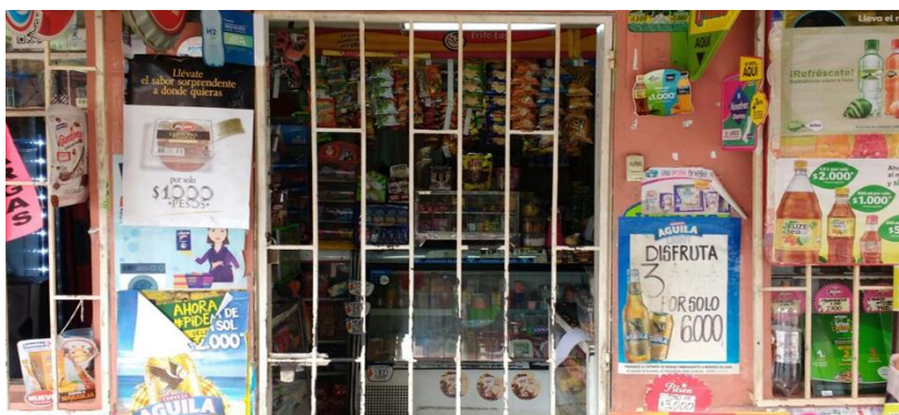
Figura 9, en esta imagen se logra ver gran cantidad de material P.O.P. además de elementos de señalética y exhibición que dan cuenta de la gran influencia comercial que tienen estos lugares.

Otra categoría encontrada en este apartado fue implementos esenciales para el trabajo , estos son todos los instrumentos utilizados para el desarrollo de las actividades comerciales dentro de las casas-negocio. Estas categorías con influencia del espacio comercial culminan con la de material P.O.P. que corresponde a todos los insumos brindados por las marcas de productos relacionados con el negocio, usualmente con fines publicitarios, y la categoría de señalética que se compone del material concebido y dispuesto en el local para indicar de manera acertada a los usuarios información importante al criterio del dueño del negocio.