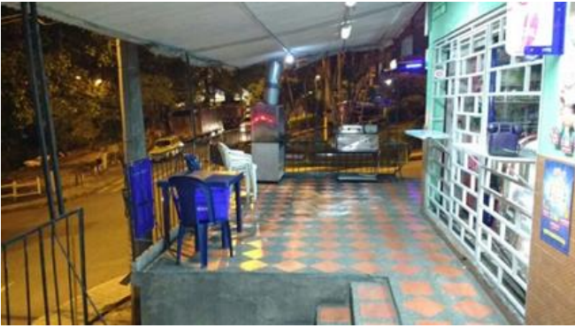
Figura 11, en esta tienda externo a su tipología base, en la acera de este local, los mismo dueños tiene un negocio de asados.

Siguiendo un hilo conductor, luego de hablar de las motivaciones que llevan a la implementación de los negocios a la vivienda, un orden lógico nos redirige a tocar el tema de cuáles son las transformaciones arquitectónicas más comunes en este tipo de lugares, y si es imprescindible el tener que transformar el espacio arquitectónicamente o si la implementación del espacio comercial se puede lograr por medio de otras herramientas. Con respecto a estas interrogantes, desde el trabajo realizado podemos afirmar que no necesariamente se necesita intervenir en la estructura física del hogar, debido a que, en algunos de los lugares observados, se logró la instauración del negocio por medio de herramientas alternativas, cómo lo es sacrificar espacios del hogar cómo el parqueadero o la sala. Por lo que no es obligatorio intervenir la arquitectura de la vivienda para poder implementar el espacio comercial, pero si es algo muy común y que puede ayudar mucho al funcionamiento del establecimiento en cuestión, ya que como hemos afirmado anteriormente los espacios domésticos y pseudo-públicos responden a necesidades diferentes, y complacer las exigencias del espacio comercial con las limitantes que el espacio privado presenta tiende a ser algo complicado.