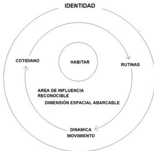
Ilustración 2 (Figura 2 , gráfica sobre el habitar, lo cotidiano y la identidad elaborado por el grupo)

Durante los últimos 30 años el crecimiento barrial y la transformación de vivienda horizontal a vivienda vertical es cada vez más común; este fenómeno ha llevado a que la composición de los barrios cambie, presentando nuevas formas de habitar este espacio. A partir del siguiente gráfico podemos identificar como está fundamentada esta investigación.