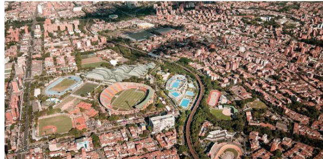
Laboratorio de Arquitectura y Paisaje, 2011

Ilustración 7 (figura 7, paralelo del área de Estadio entre el registro fotográfico de la Biblioteca Pública Piloto y actualidad)