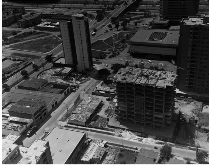
Ilustración 6 Figura 6 ,Aérea Suramericana, Carvajal Pérez (1976).

Las construcciones cercanas no invierten en el mantenimiento del espacio público en el que se van a construir, por ende lleva a que estos espacios públicos en los barrios se vea descuidada y puedan ser incluso inseguros para los habitantes debido que no están habitados y carecen de una sensación de cuidado.