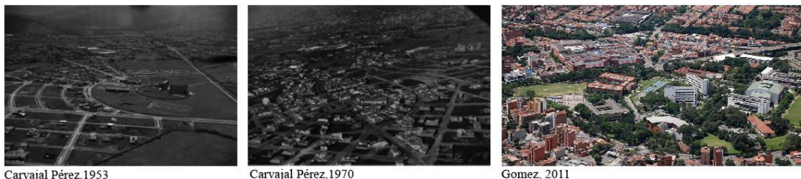
Ilustración 5 (figura 5 , paralelo del área de Bolivariana entre el registro fotográfico de la Biblioteca Pública Piloto y actualidad)

En la anterior imagen se puede evidenciar el claramente crecimiento demográfico de la zona, en la cuál se ve el incremento de edificios y demás estructuras lo cual es claro que hay un aumento en la población y por ende en sus necesidades.