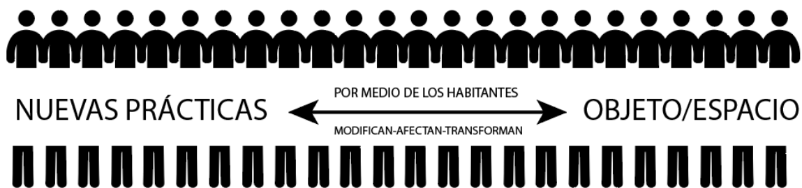
Ilustración 3 (Figura 3, Apoyo de justificación de nuevas prácticas y los objetos que habitan elaborado por el grupo )

Acercándose más al diseño industrial, los objetos se ven configurados en el ambiente, este ambiente está constantemente en contacto a nivel personal y espacial, por lo cual lleva a que su relación con el usuario y su hábitat sea diferente cada vez más. Como se puede ver en el siguiente gráfico,