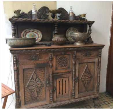
Bife que hoy es utilizado para guardar objetos vajilla antiguos