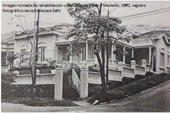
Imagen tomada de rehabilitación urbana barrio Prado – Medellín, 1992.