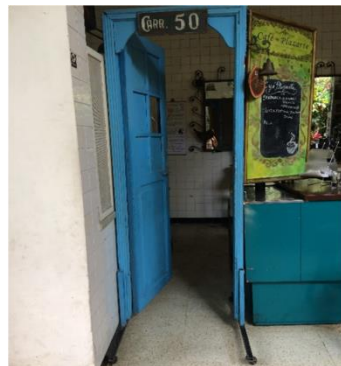
Puerta de casa adaptada para el ingreso a la cocina de un bar