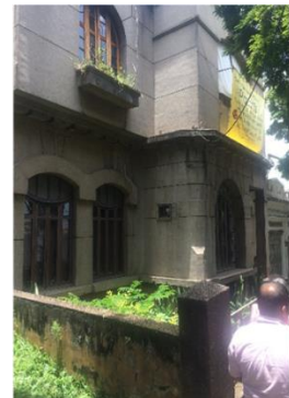
Fotos tomadas en trabajo de campo Fachada Plazarte