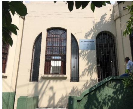
Fachada Casa Patrimonio