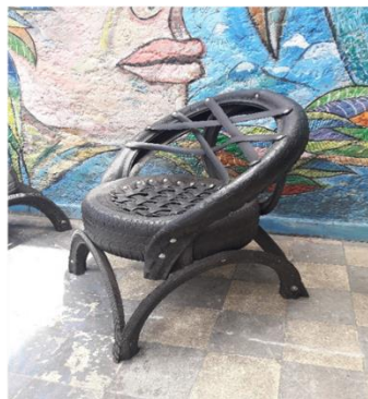
Llanta transformada en mobiliario para uso exterior