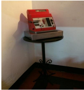
Caja registradora que hoy se encuentra en el área destinada para el comedor como objeto ornamental.