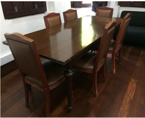
Mesa de comedor que hoy es utilizada como mesa de trabajo

Adicionalmente se encontraron objetos que se conservan, ya que no son modificados morfológicamente y su uso sigue siendo el mismo al planteado en el pasado, por intención de los propietarios quienes intentan conservar el estado original del objeto.