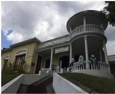
Fachada Casa Prado

Por ende la conservación externa, el nivel 2: las fachadas de estas casas no pueden ser modificadas, solo restauradas, donde el descuido de parte del propietario hacia estas, ya sea por falta de dinero u otras razones, genera una sensación de abandono principalmente por la pintura desgastada, ventanas y puertas en malas condiciones; adicionalmente que todas se encuentran enrejadas y con candados. Además, la imposibilidad de poner elementos comunicativos permanentes en las fachadas impone una barrera entre la actividad dentro del centro cultural y la comunidad.