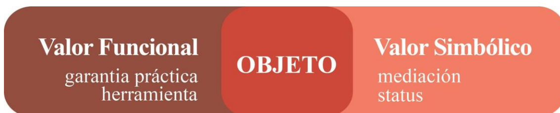
Figura 2: Relaciones de valor entre el objeto y las características propias de cada uno, con base en la teoría crítica de Jean Baudrillard.