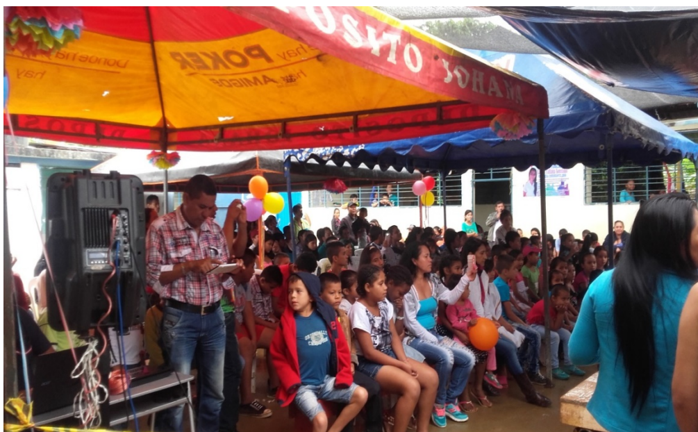
Foto capítulo dos. Día de la familia.