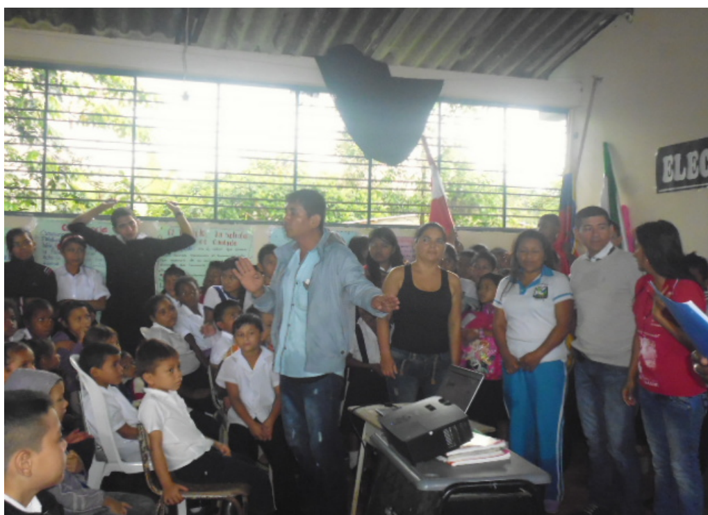
Foto capítulo tres. Día de los valores.