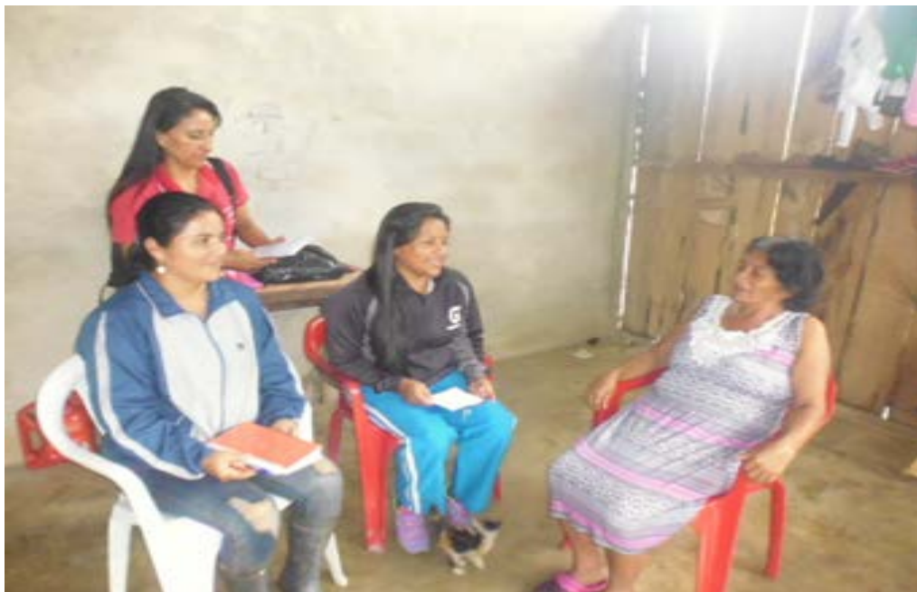
Foto capítulo uno. Visita a hogares de estudiantes.