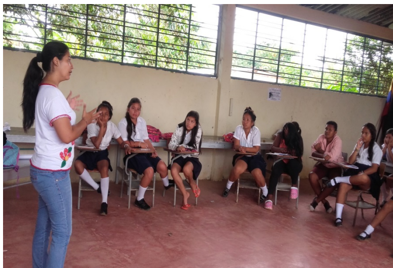
Figura II. Estudiantes grado sexto. Sede Poblado.

mantenido una estrecha relación con los mismos, lo que nos ha permitido seguir colaborando y realizando actividades con ellos.