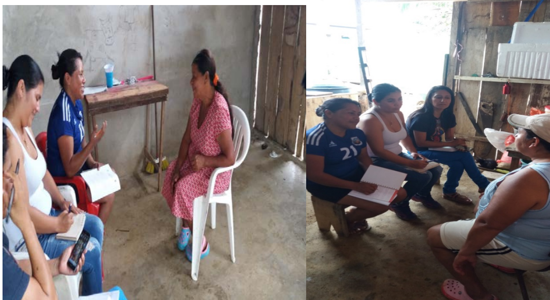
Figura IV. Visita a padres de familia del grado sexto. Sede Poblado.

R/ He tenido algunos problemas, pero el que más me preocupa ahorita, es que mi hija me conto que estaba inhalando b6xer, entonces me sent6 a conversar con ella y lloramos juntas al decirme que lo hac6a porque se sent6a muy sola.