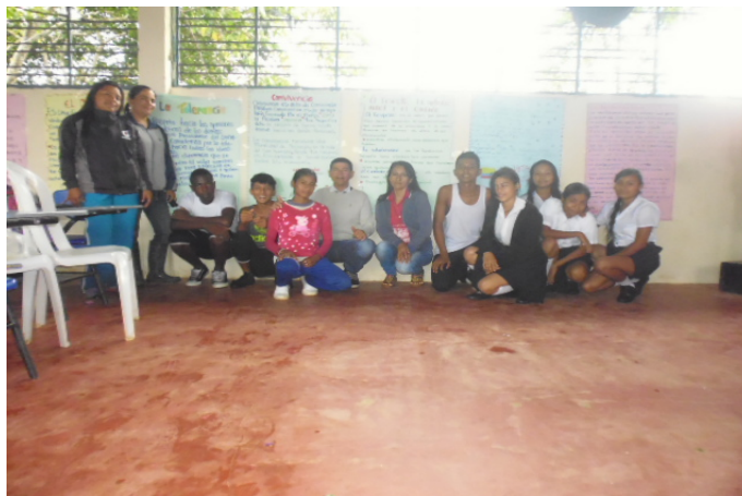
Figura VI. Día de los valores. Sede Poblado.