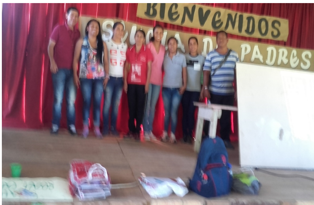
Foto capítulo tres. Escuela de padres.