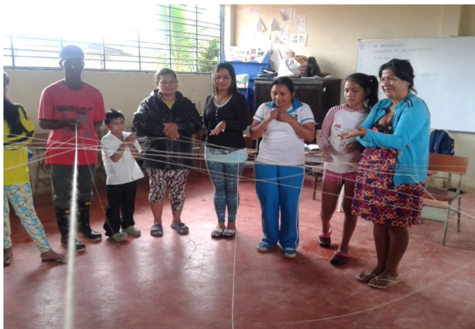
Foto capítulo tres. Escuela de padres.