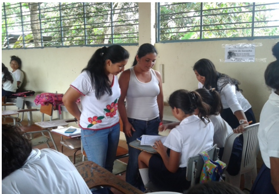
Foto capítulo tres. Escuela de padres.