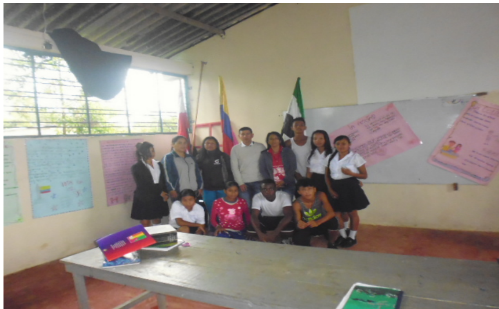
Foto capítulo tres. Festival de carteleras.