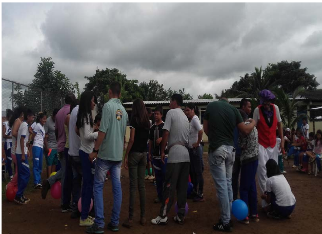
Foto capítulo dos. Jornada lúdica.