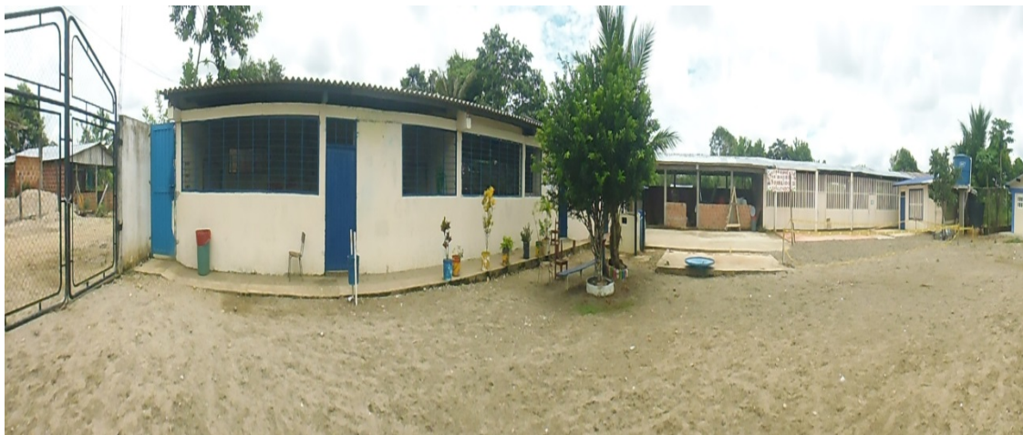
Figura 1. Centro Educativo Rural El Danubio- sede El Poblado

El primer contacto con el grupo focalizado fue el periodo de diagnóstico, que se realizó a través de la observación directa de las conductas durante los primeros días en el aula, pasillos, y tiempo de recreo, lo cual confirmó los problemas detectados. De igual manera se realizó la entrevista instrumento que utilizamos para extraer información de nuestro grupo focalizado, el cual nos arrojó las diferentes dificultades que estaban viviendo nuestros niños en el ambiente escolar. Con el fin de conocer la problemática más a fondo se invitó a los padres de los estudiantes del grado sexto, a una reunión para conocer el ambiente familiar en el cual se encuentran, de este encuentro se tomó la respectiva acta N° 01, la cual evidenció las dificultades o problemas que afrontan nuestros estudiantes dentro del hogar. Para concluir el proceso que nos llevó identificar las conductas que evidencian crisis o ausencia de valores en el grupo de estudio se realizó una visita a las familias de los estudiantes que han presentado mayor dificultad en el proceso de convivencia dentro de su grupo escolar, las cuales nos permitieron abordar el problema con más certeza de lo que sucedía en nuestro contexto escolar. Desde entonces se ha