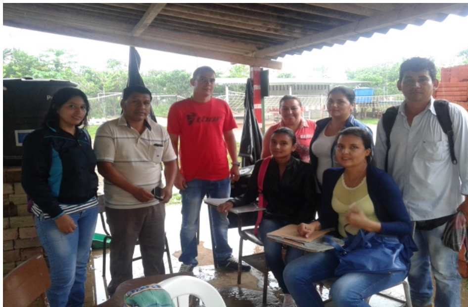
Foto capítulo dos. Intervencion con personal idoneo.