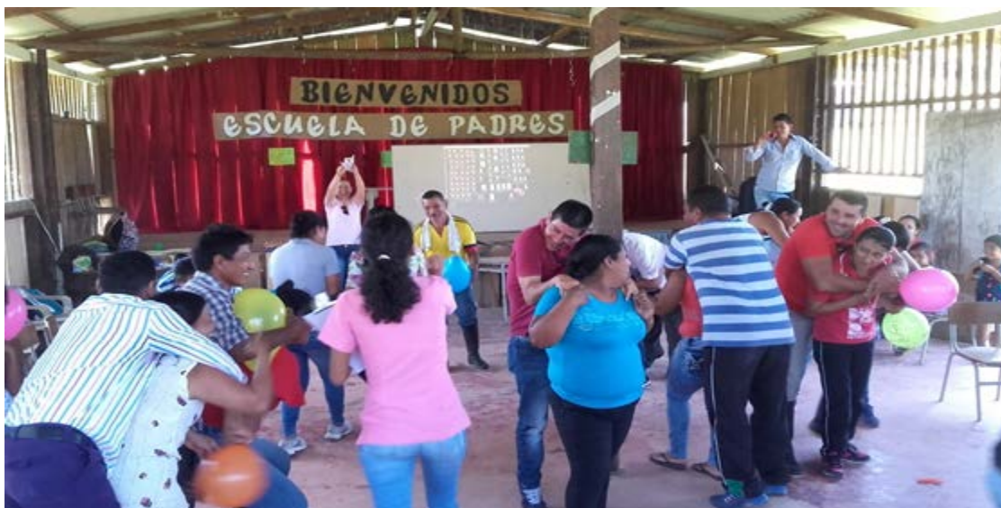
Figura VII. Escuela de padres. Sede Danubio.

Respecto a las actividades de la escuela de padres se logró propiciar un buen ambiente, dentro del cual se pudo establecer el dialogo, mediante el cual se escucharon las diferentes situaciones que se están presentando en los hogares y se pudo brindar asesorías en cuanto a la práctica de valores, pretendiendo solucionar estas situaciones difíciles por las cuales están atravesando y evitando muchas otras.