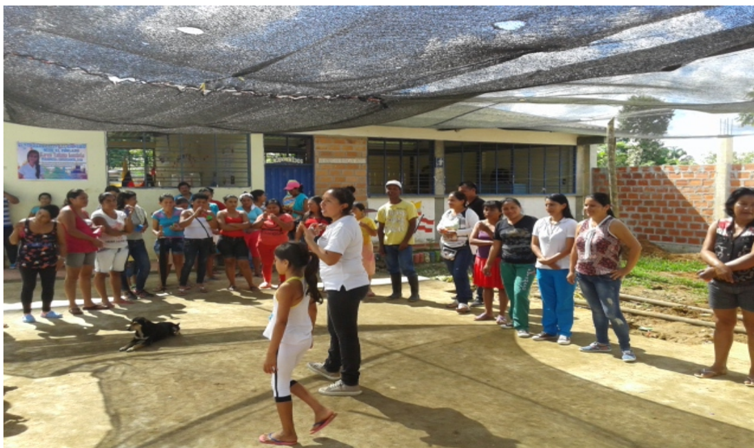
Figura VIII. Escuela de padres. Sede Poblado.

Luego de la investigación realizada para obtener información acerca del comportamiento de los estudiantes del grado sexto del Centro educativo rural Danubio, se logra evidenciar que la ausencia de valores se debe en mayor grado a la falta de acompañamiento de los padres de familia, quienes son la base principal en la formación del niño. Por ende, cabe decir que uno de los principales aprendizajes significativos, tanto para los docentes investigadores como también para la comunidad de padres de familia se logró a través de las diversas actividades realizadas mediante “la escuela de padres”, sensibilizando a la comunidad educativa sobre la importancia que tiene el acompañamiento y la dedicación de los padres para con sus hijos; pues en este punto radica la formación de buenos valores en los niños.