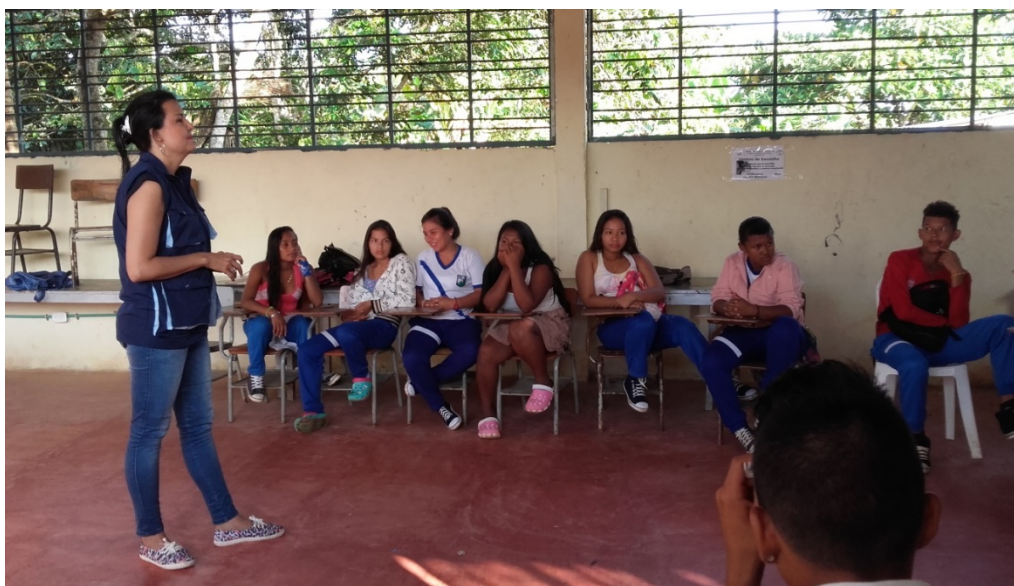
Foto capítulo dos. Intervención con orientación psicológica.