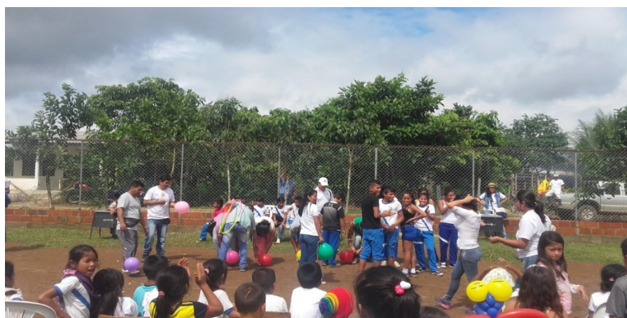
Figura V. Celebración día del niño. Sede Poblado.

Artesano de la afectividad y el buen trato: Técnica creada para la construcción de mejores dimensiones de auto afectividad y socio afectividad a partir de la potenciación de nuestra dimensión de buen trato en cualquier tipo de relación.