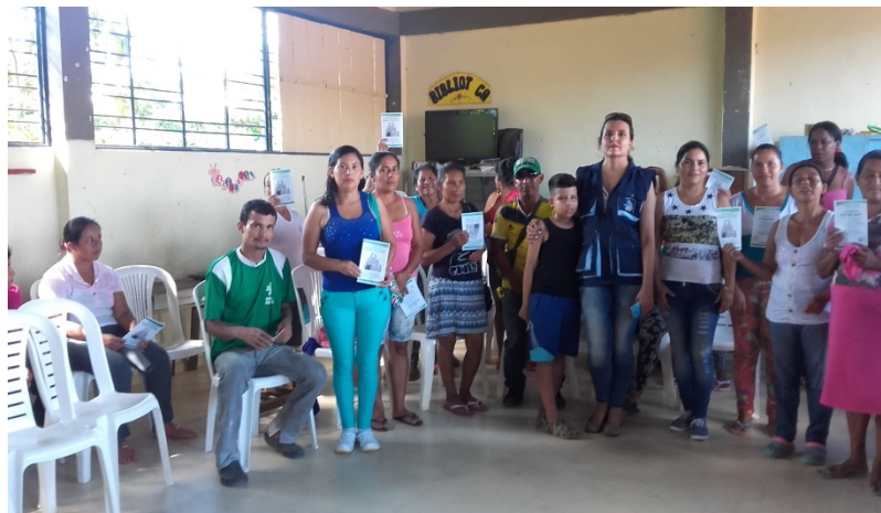
Figura III. Padres de familia del grado sexto. Sede Poblado.