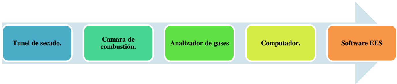
Figura 1 Pasos metodológicos de la investigación