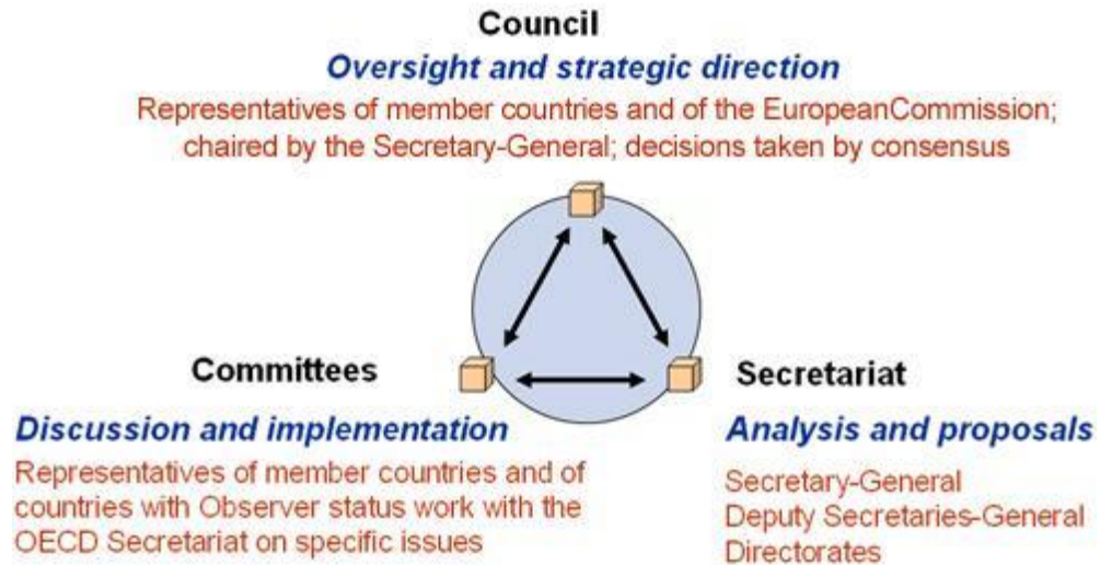
Grafico 1: ¿Quién dirige a la OCDE? (Organisation for Economic Co-operation and Development, s.f.)