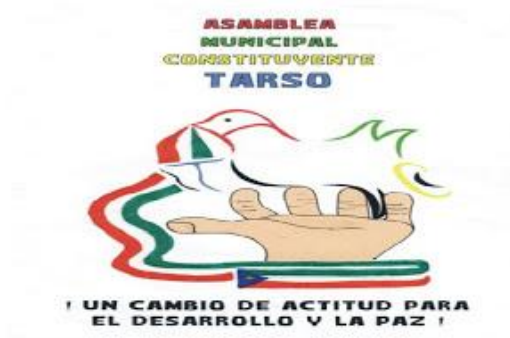
Imagen 3: Logo AMCT