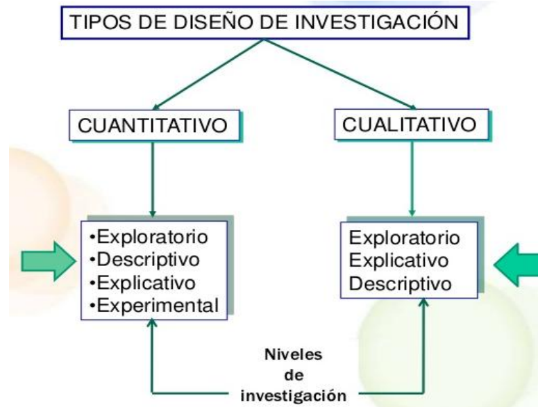
Tabla 1: Tipos de Investigación