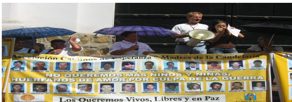
Imagen 16. "madres de la candelaria" se aprecia a los líderes de dicha organización, quienes por medio de pancartas hacen memoria de familiares y personas desaparecidas.

Así mismo otra forma de dar cumplimiento al anterior objetivo, se establece en que la representación simbólica de objetos, permite a dichas personas generar discursos participativos para su transformación, donde dichas personas plasmen en sitios significativos, rurales o urbanos, objetos (ver imagen 16), que permitan generar en la población no afectada, propuestas participativas donde se haga conciencia de la necesidad de la no repetición de los hechos violentos.