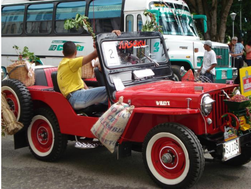
Imagen 7: Carros cargueros: son coloridos, donde en la parte de atrás sus propietarios colocan una serie de objetos alusivos a su región como (bultos de café, ruanas.etc)

Esto reafirma que los patrones de identidad que se establecen a través de los objetos se generan desde los discursos disponibles en la sociedad. En este sentido Halbwachs (1990), sostiene que "la razón por la que los miembros de un grupo permanecen unidos, aún después de dispersarse y de no encontrar en su nuevo ambiente físico nada que les recuerde el hogar que han dejado, es que piensan en el viejo hogar y su arreglo general" (p. 13).