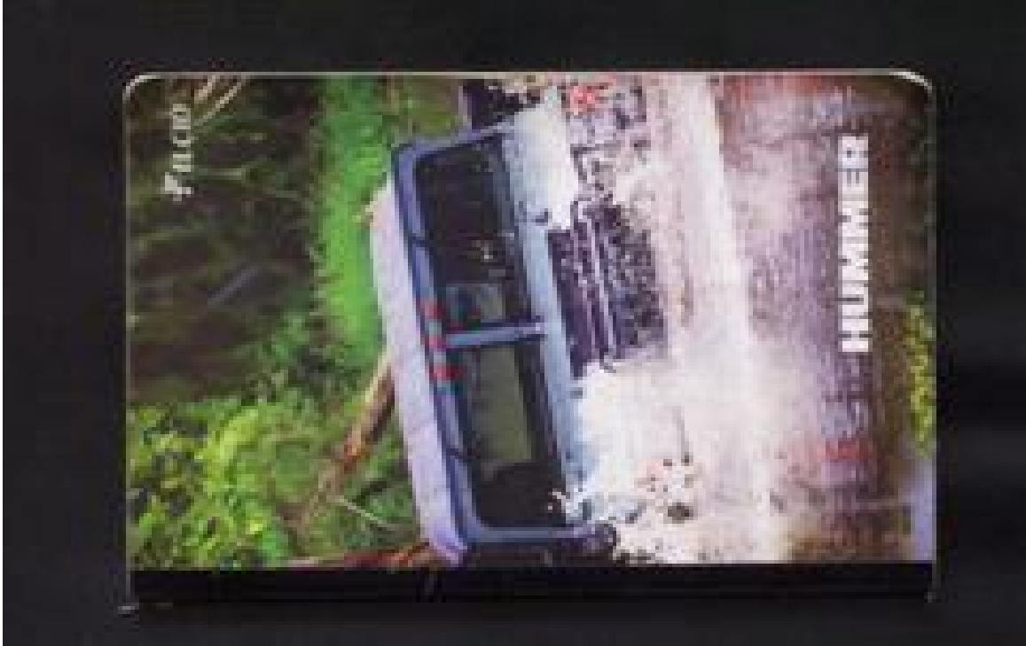
Imagen 3 "diario de tesis" o "cuaderno de tesis" se aprecia la carátula de un cuaderno que siempre estuvo presente desde la primera hasta la última reunión de tesis.

cierto es que hoy 29 de enero de 2007 lo único que sabemos de la tesis es NADA”.