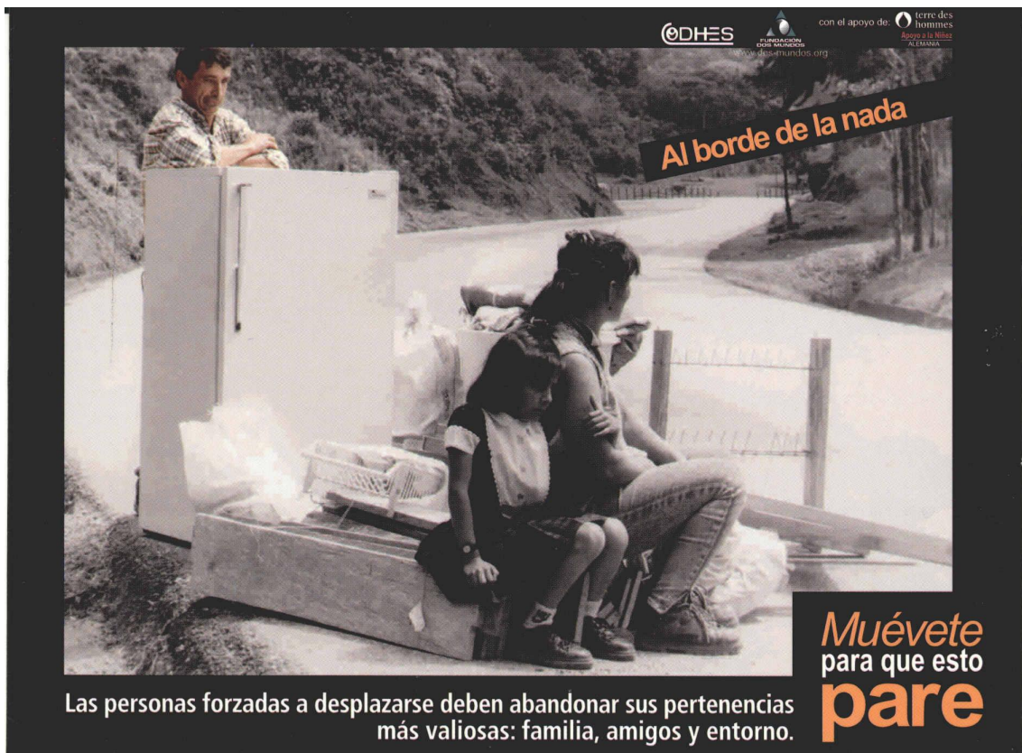
Imagen 0: "Al borde de la nada".