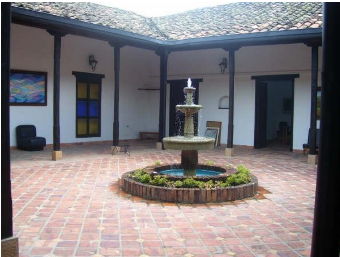
Imagen 10: "patio del C.P.S. de Piedecuesta" se observa la fuente, que en algunas ocasiones adornada con palomas, presencio algunas reflexiones sobre la investigación.

afectadas por el conflicto armado, que se encuentran en situación de desplazamiento del municipio de Piedecuesta", estos dos elementos no tenían ninguna certeza de veracidad, ya que no teníamos ningún contacto con dicha población, o como lo expresó alguno de nosotros "¿las personas que viven en dicha situación si estarán interesados en participar en el proyecto de investigación?", "¿Cómo hacemos el proceso de convocatoria, para que la población se interese en el proyecto?", "¿En donde encontramos dicha población?".