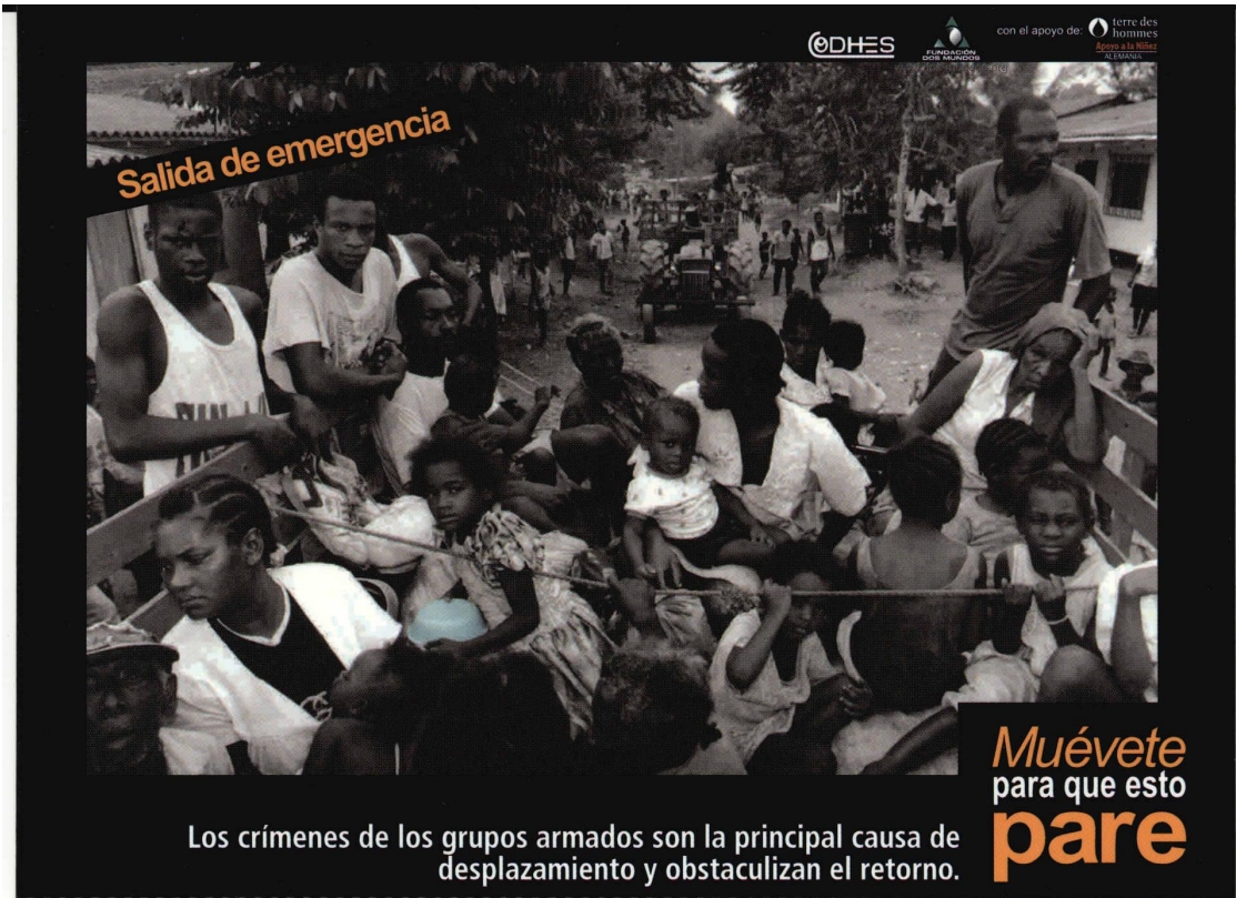
Imagen 14: "Salida de Emergencia".