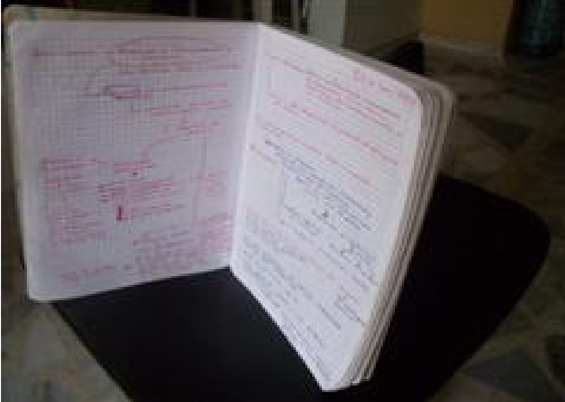
Imagen 2: letras rojas: se aprecia en las hojas del cuaderno de tesis, la escritura de con lapicero rojo sobre las diferentes reflexiones mantenidas en las reuniones de tesis.

único que sabíamos era que la tesis giraría en torno a la temática Memoria Colectiva, pero de preguntas y de títulos del proyecto sabíamos las mismas cuatro letras "NADA".