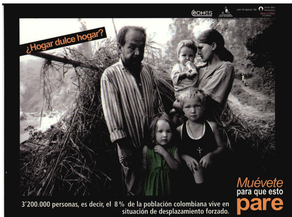
Imagen 1: "¿Hogar dulce hogar?".

PORQUE ES UNA SOLA HISTORIA, CONTADA POR DIVERSOS AUTORES. LA MISMA HISTORIA DE LA QUE HACEMOS PARTE TODOS.