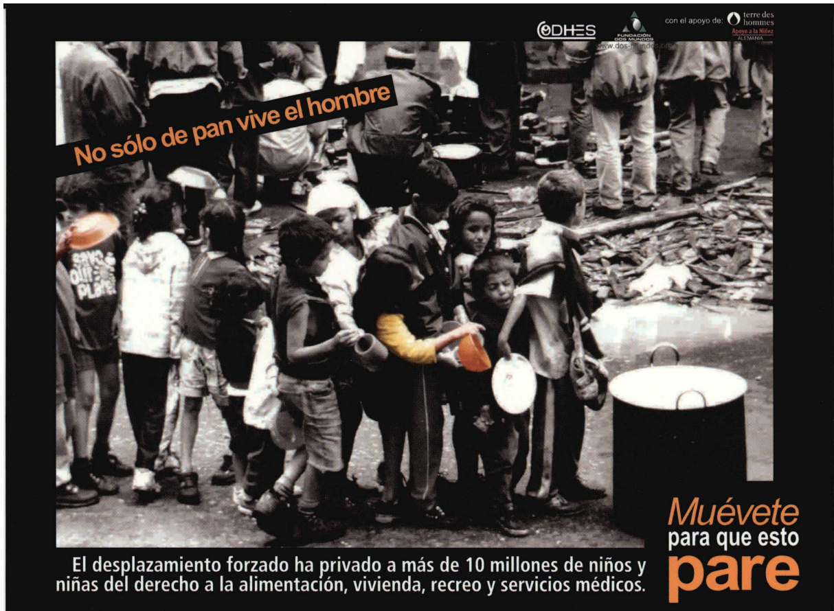
Imagen 15: "No sólo de pan vive el hombre". Donadas por COOHES.