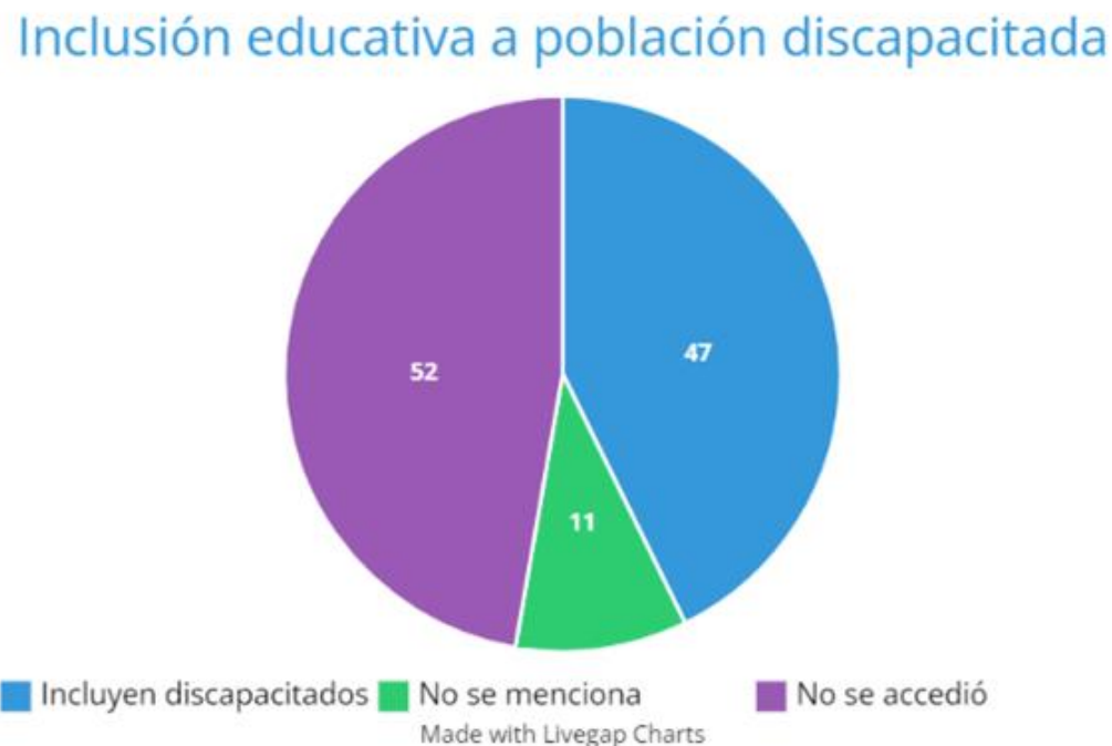
Gráfico de Instituciones que incluyen a la población discapacitada

En las 110 instituciones que se investigaron en Medellín encontramos unos datos preocupantes. Aparte de que 52 de estas no tienen un PEI público, solo 47 de las 110 incluyen a discapacitados. A pesar de que algunas de estas son bastante organizadas, tienen un estimado de