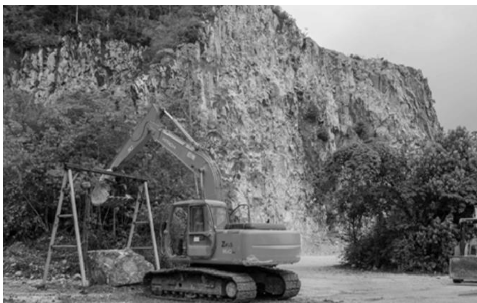
Figura 2 Principal mina de mármol cercana al corregimiento de La Danta

Fuente: El Camino Sembrado. Nota: Crónicas Estudio de Caso del Proceso de apropiación y poblamiento de los corregimientos de Aquitania, El Prodigio, San Miguel, Jerusalén y la Danta El Camino en el Oriente de Antioquia. Página 63. Año 2014