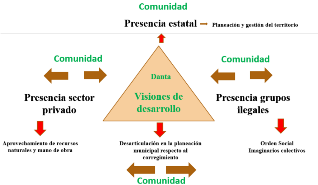
Figura 4. Actores presentes en el territorio