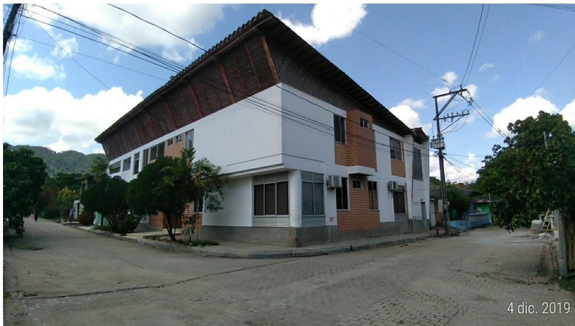
Figura 8. Centro de salud, corregimiento de La Danta, Sonsón