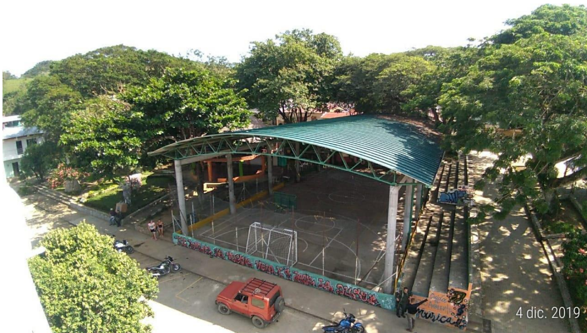
Figura 7. Parque central corregimiento de La Danta. Polideportivo