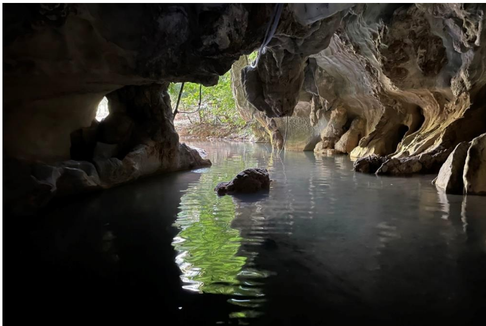
Figura 6. Caverna Los Guácharos

Fuente: PhD en Ciencias Sociales JOSÉ ROBERTO ÁLVAREZ MÚNERA. 2022