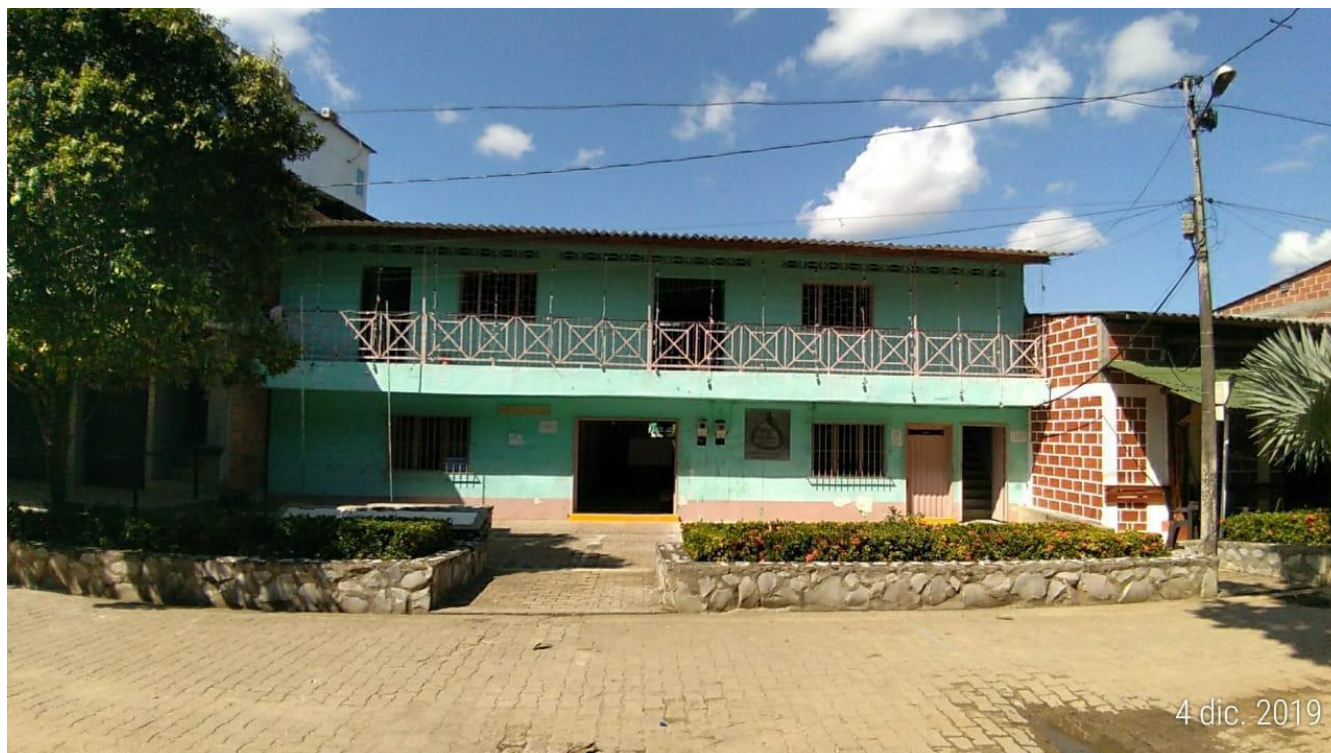
Figura 3. Comisaria de familia y empresa Aguas del Páramo, corregimiento de La Danta, Sonsón

La Danta, Sonsón Antioquia, 2019