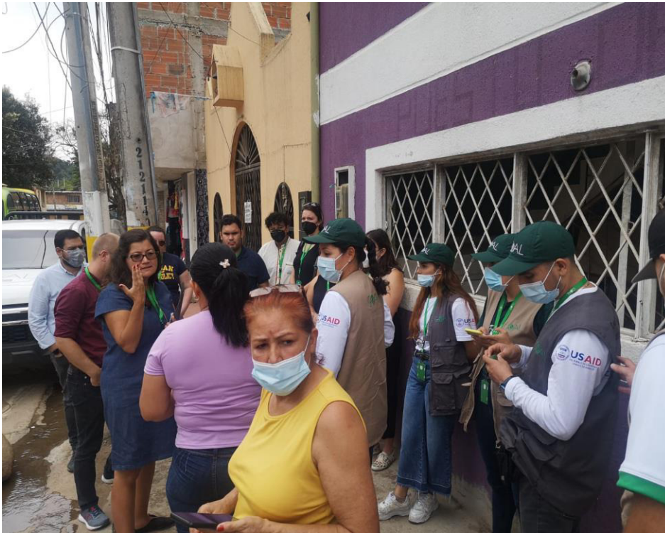
foto 4 Reunión con miembros de la Universidad de Michigan 4 agosto 2022