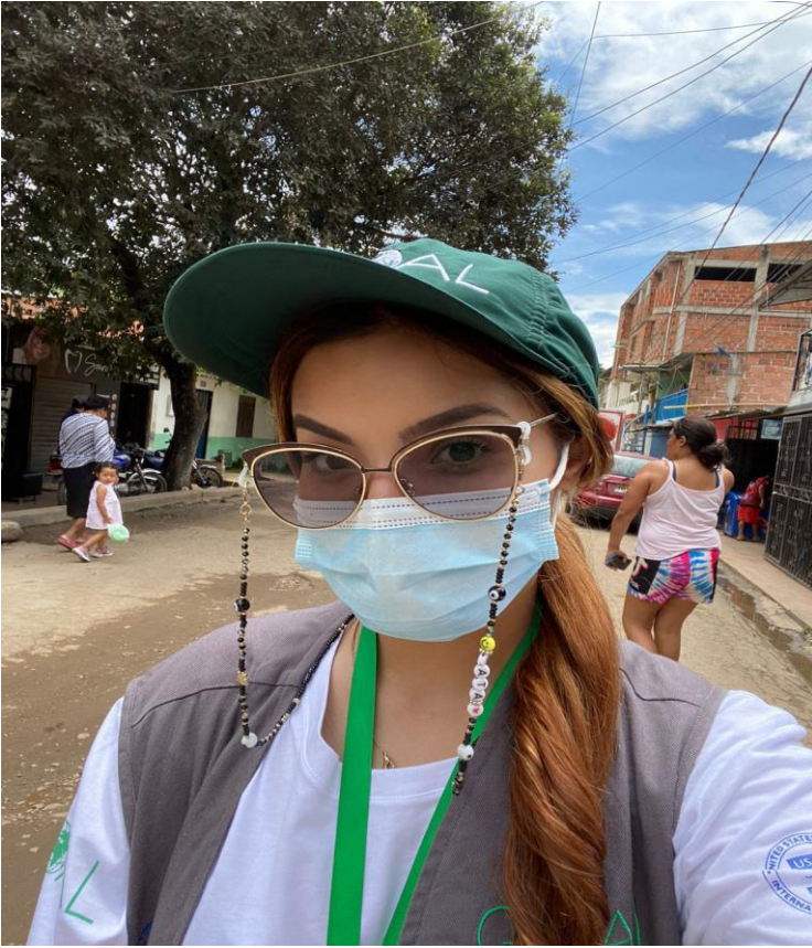
foto 6 Salida a Campo José Antonio Galán 21 octubre 2022