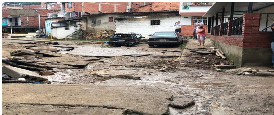
Ilustración 2. Barrio 5 de Enero

En la Ilustración 2 se muestra una imagen tomada de Blue Radio (2022) de cómo es el barrio 5 de Enero.