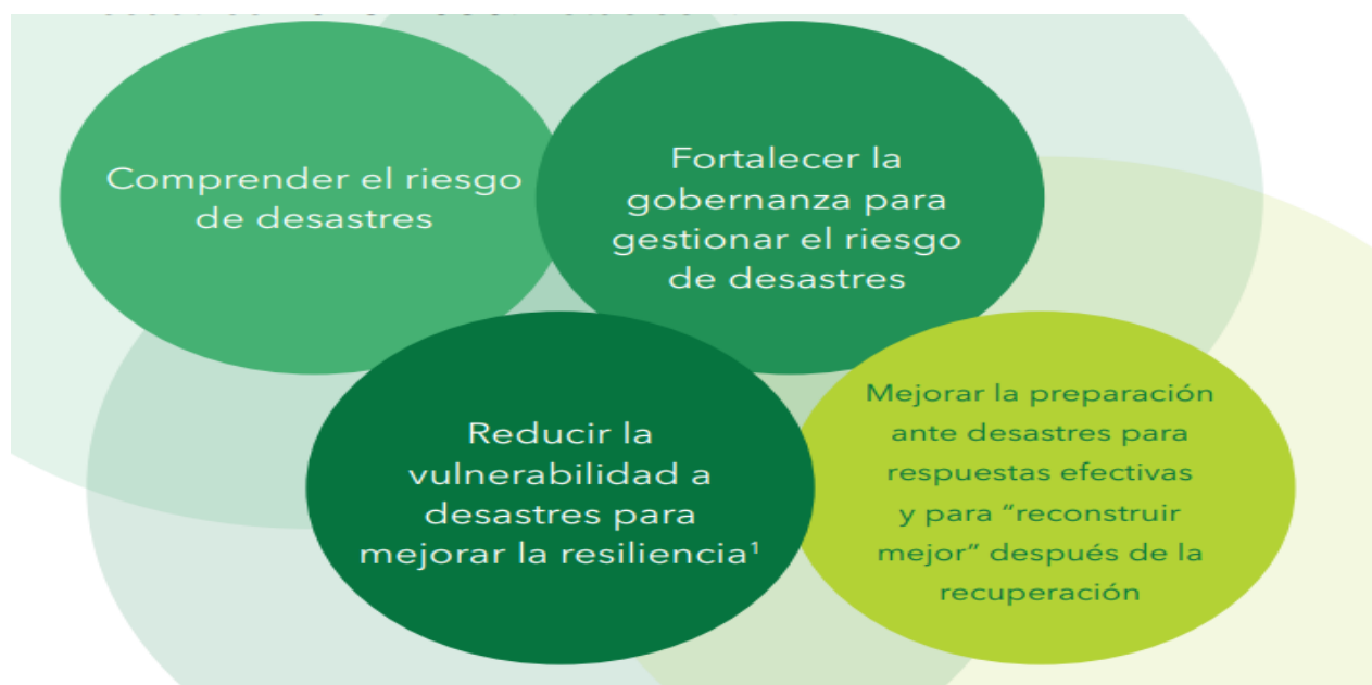
Ilustración 6 áreas temáticas

Para la implementación de este instrumento, se realizó una encuesta basada en la discusión de 30 componentes, los cuales abarcan 4 áreas temáticas, según las Prioridades de Acción del Marco Sendai para la Reducción de Riesgo de Desastre 2015-2030, como se ve en la Ilustración 6