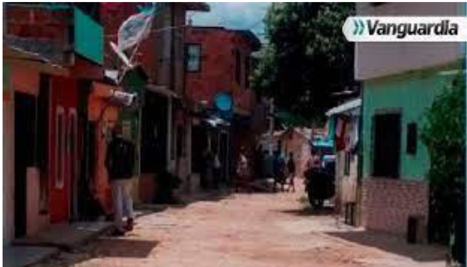
Ilustración 3 Barrio José Antonio Galán

En la Ilustración 3 se muestra una imagen del asentamiento tomada de Vanguardia Liberal (2019)