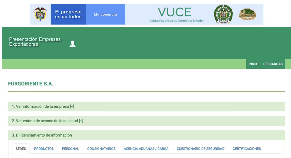
Ilustración 2 Cuenta Furgoriente S.A. Policía Antinarcoóticos