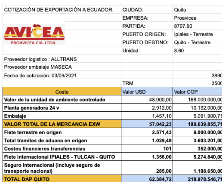
Ilustración 6 Cotización Ofertada Ecuador