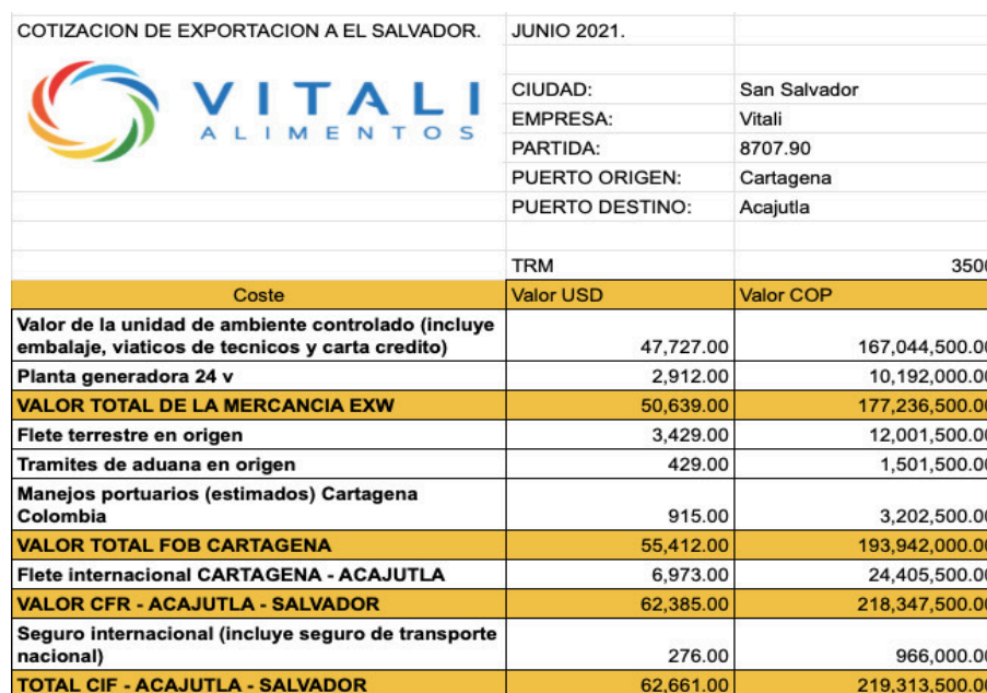
Ilustración 5 Cotización Ofertada El Salvador