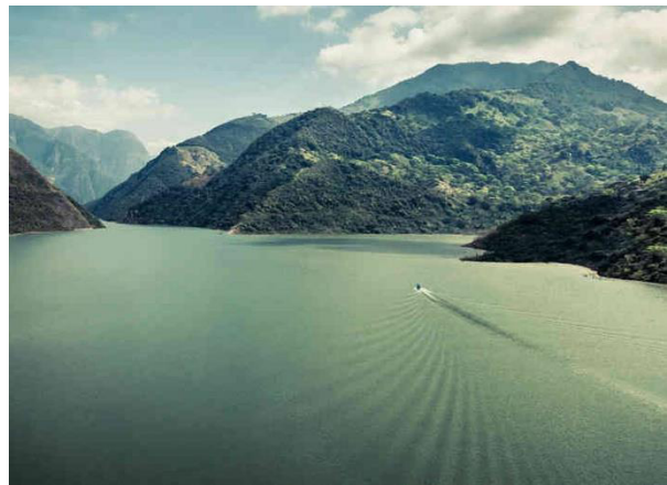
Ilustración 13 Embalse de Topocoro

económico para seis municipios del departamento. Asimismo, ha sido considerada una de las cinco centrales que más genera en el país; con una capacidad instalada de 820 megavatios (MW), lo que equivale a 5.056 megawatts - hora (MWh) al año. Por último, este gran proyecto también ha contribuido al desarrollo de actividades como el turismo ecológico.