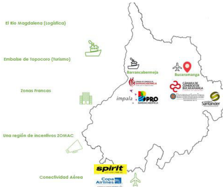
Ilustración 11 Mapa de Santander