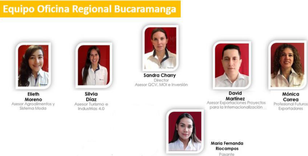
Ilustración 3 Organigrama oficina regional Santander