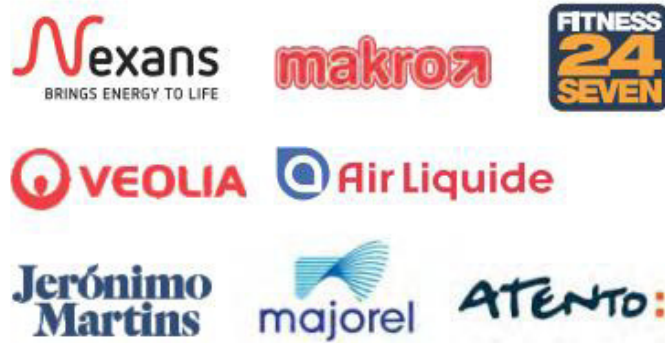
Ilustración 24 Empresas Instaladas