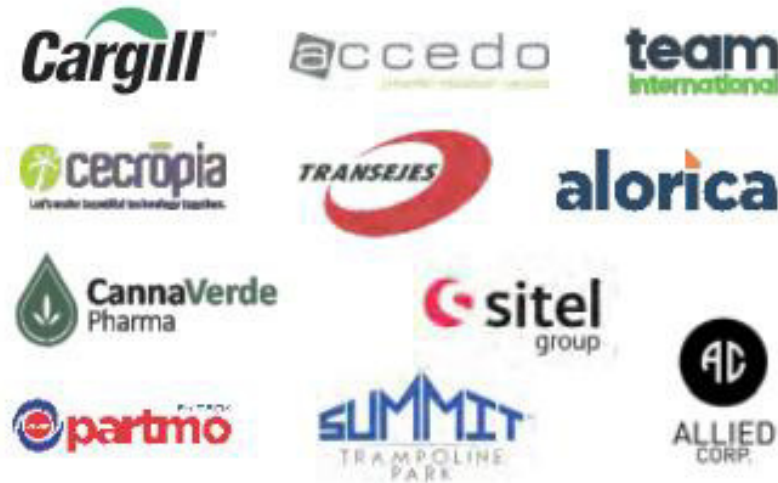
Ilustración 22 Empresas Instaladas