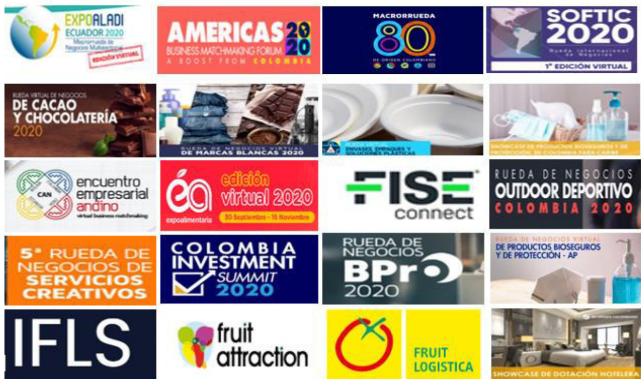
Ilustración 21 Algunas actividades realizadas durante el 2020

Se presentarán las actividades con más valor de interés que se desarrollaron durante el año actual en ProColombia; en estas se realizaron agendas virtuales de empresas nacionales con compradores internacionales de diferentes partes del mundo.