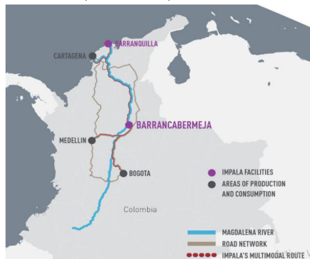
Ilustración 12 Operaciones de Impala en Colombia

A continuación podrán visualizar en los puntos de color morado las facilidades de rutas hacia otras ciudades, de color gris las ciudades donde se encuentra las áreas de producción y consumo, en color azul por donde atraviesa el Río Magdalena, de color marrón la red de carreteras y por último la ruta multimodal de Impala.