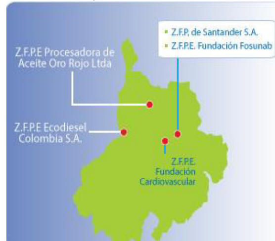
Ilustración 17 Grafica de las 4 Zonas Francas en Santander