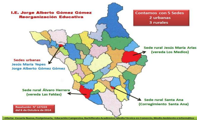
Figura 1: Ubicación de las sedes del IE Jorge Alberto Gómez Gómez de Granada, Antioquia; fuente: PEI institucional

Frente a esta realidad, nace el interés por desarrollar esta propuesta de intervención psicopedagógica, en tanto puede favorecer las dinámicas educativas de los estudiantes con discapacidad psicosocial, pero además de un deseo profundo por comprender las implicaciones de la estigmatización frente a la enfermedad mental permanente o transitoria y la vulneración de derechos de esta población, de la cual yo en algún momento de mi vida hice parte.