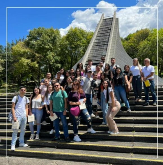
Imagen 3 Recorrido con los estudiantes de Comunicación Social de la Universidad Católica Luis Amigó. Al fondo, la capilla La Asunción, Cementerio Campos de Paz.