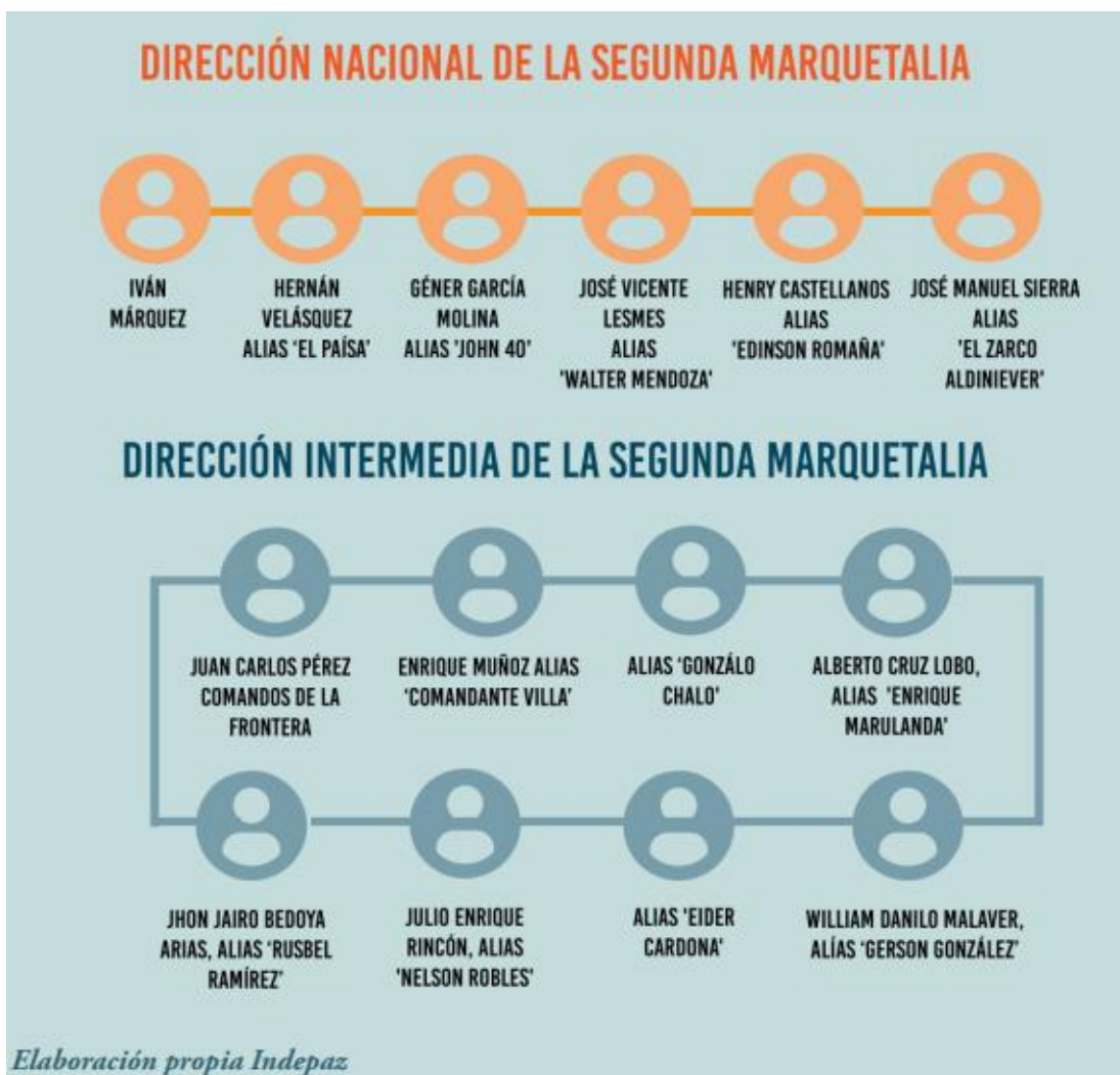
Figura 1. Segunda Marquetalia