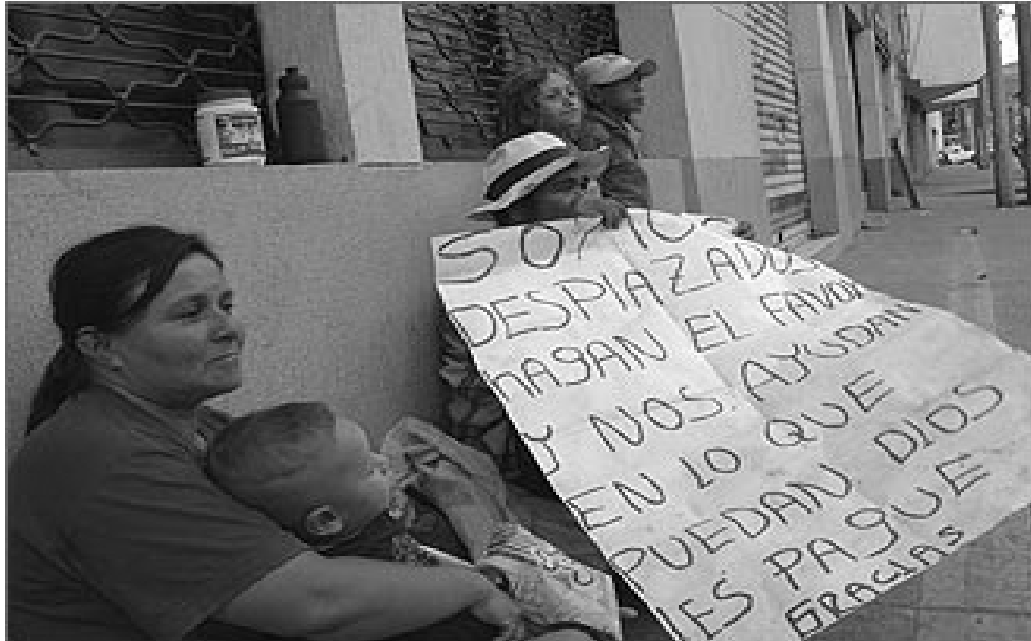
Mártires (Bogotá). Junio 2009