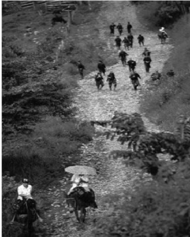
Uribe (Meta). Octubre de 2008