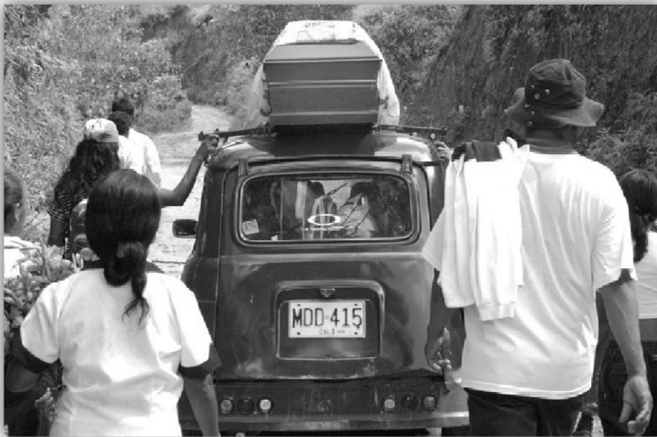
Vereda de Ortega (Cauca). Abril 2008

Imagen 4 y 5: "Sin Rastro. Imágenes para construir memoria". Fundación Dos Mundos.