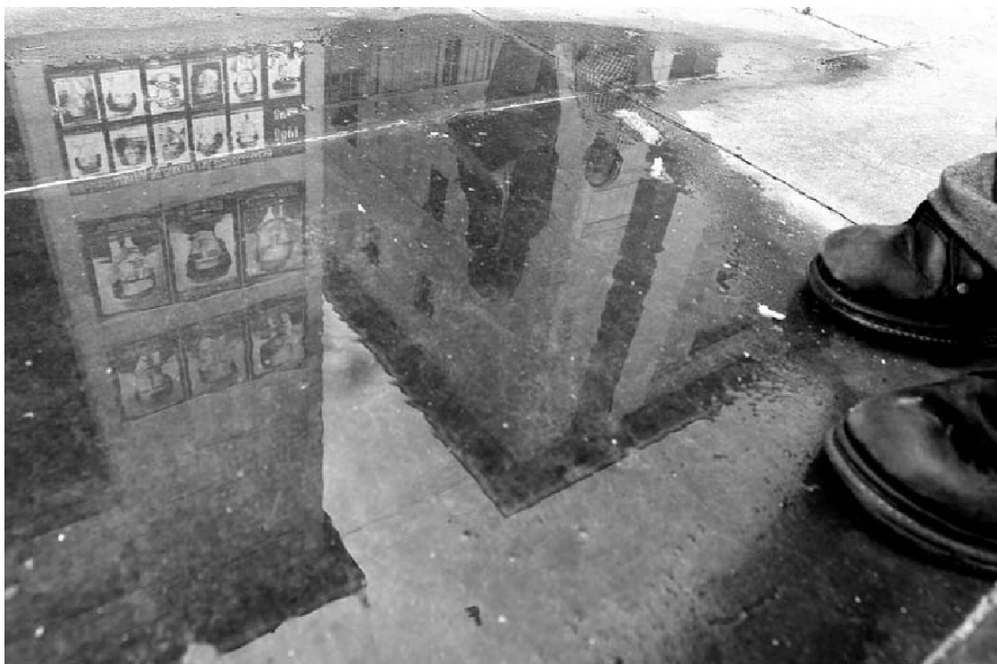
Plaza de Bolívar (Bogotá). Noviembre 2005