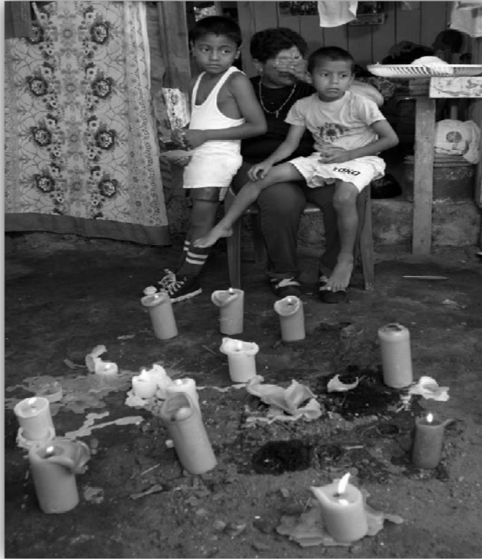
La Dorada (Putumayo). Mayo 2007