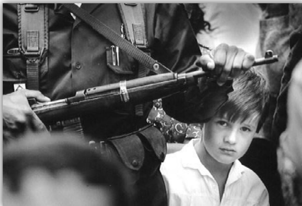
La Unión (Antioquia). Junio 2000