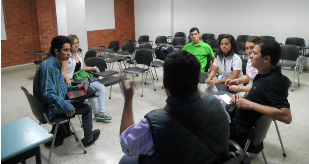
Charla informativa 19 de marzo reunión de retroalimentación a los procesos de la coordinación de internacionalización