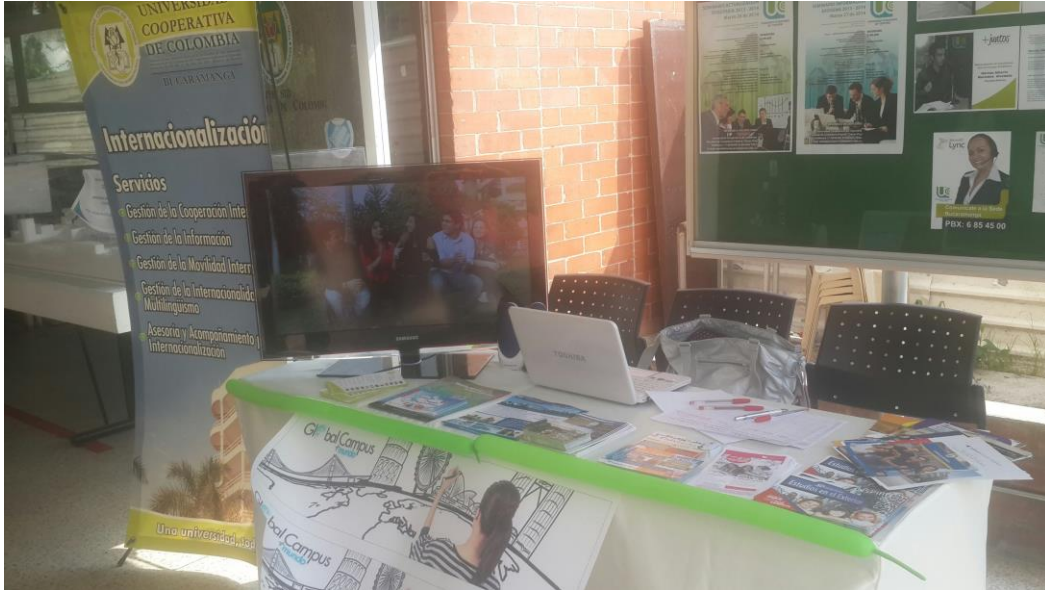
Stand informativo 2 de abril