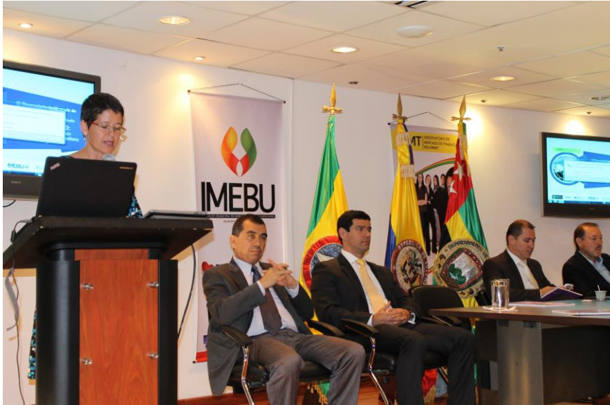
Participación de la Universidad Pontificia Bolivariana en la socialización del proyecto: Oportunidades de inclusión laboral en el área metropolitana de Bucaramanga, realizado en las instalaciones del auditorio Andrés Páez de Sotomayor de la Alcaldía de Bucaramanga.