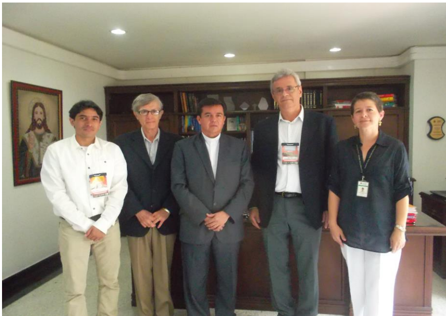
Encuentros y alianzas de investigación en la Universidad Pontificia Bolivariana con organizaciones internacionales.