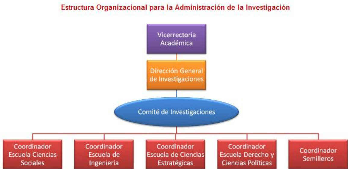
Figura 1: Modelo de estructura organizacional en la Dirección General de Investigaciones.