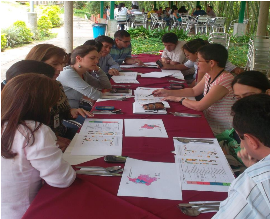
Encuentro de líderes de grupos de investigación de la Universidad Pontificia Bolivariana