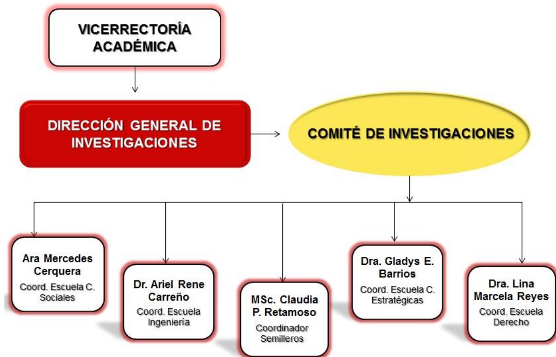
Figura 2: Estructura organizacional Año 2013.