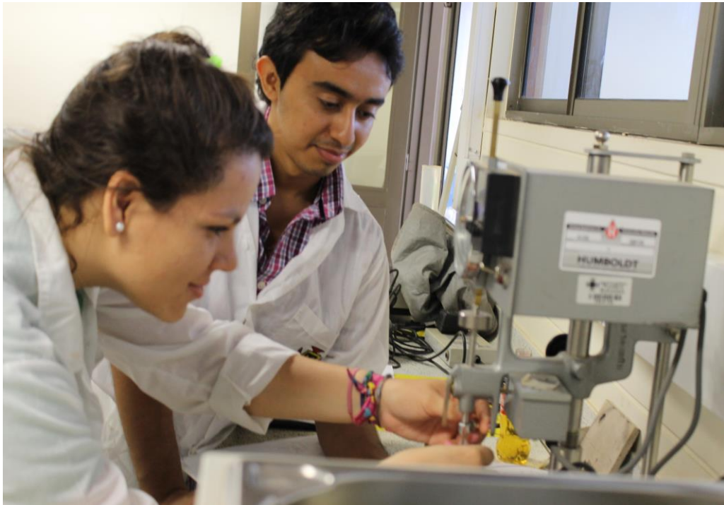
Actividades realizadas por semilleros de Ingeniería civil en el laboratorio de materiales, en el edificio K del campus universitario.