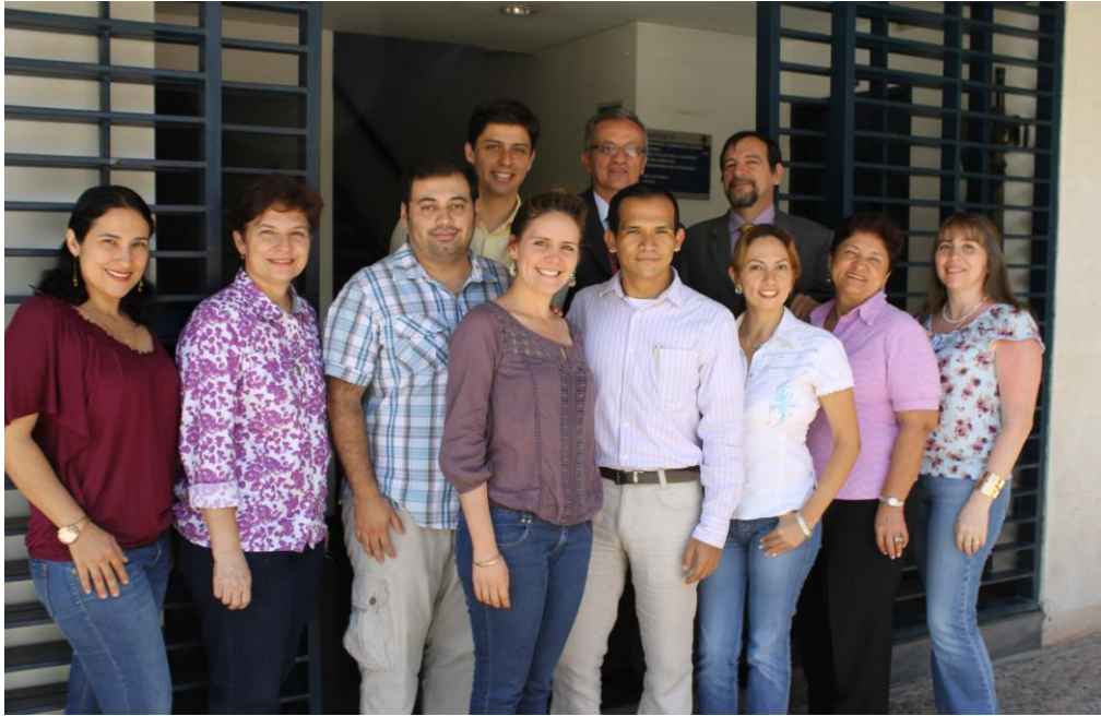
Encuentro de integrantes del grupo de investigación CIP- JURIS, facultad de Derecho.