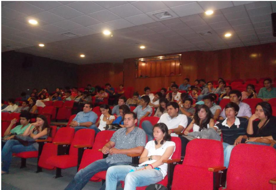
Curso de inspección de soldadura realizado en el Auditorio Mayor de la Universidad Pontificia Bolivariana seccional Bucaramanga.