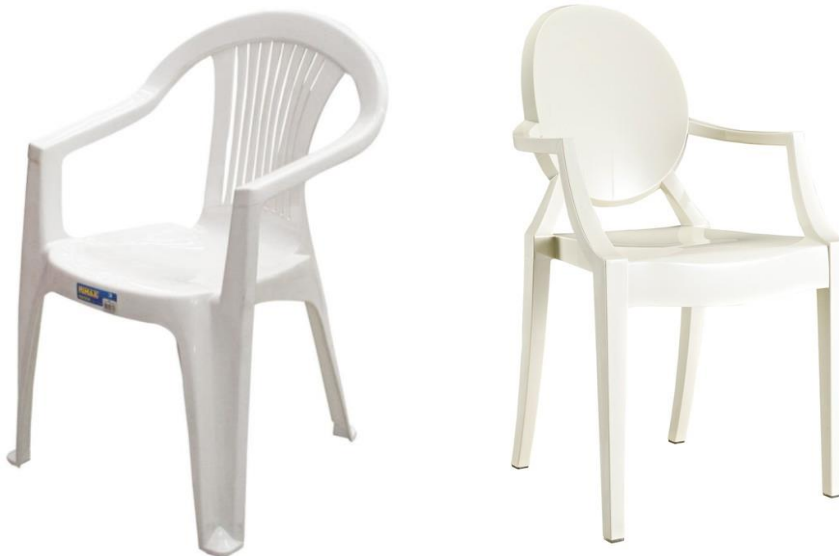
Figura 1: Objeto de estudio 1 Silla “genérica” de Rimax / Figura 2: Objeto de estudio 2 Silla “de diseño” Louis Ghost de Phillippe Starck.

Por este motivo en la intención de investigar, se comparan dos objetos del mismo tipo en dos contextos diferentes, la silla Rimax y la silla Louis Ghost de Phillippe Starck, con el fin de ser evaluados y responder a la siguiente pregunta: ¿Cómo es la valoración funcional y simbólica que las personas hacen de un mismo objeto en diferentes contextos? , teniendo en cuenta que estos han sido creados para una misma función (sentarse), pero presentan dos connotaciones diferentes, pues la silla Rimax es reconocida por su funcionalidad, mientras que la silla Louis Ghost 2 presenta un alto valor simbólico. Surge la intención de comprobar que es lo que está sucediendo en la actualidad y cómo las ideas de las personas sobre los objetos se van transformando según los acontecimientos culturales, sociales, políticos y económicos, ideas que les hacen apreciar dichos objetos de maneras tan diversas. Para lograrlo se comparan así las valoraciones que las personas hacen de una misma silla como función simbólica y como función de uso.