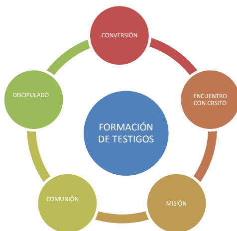
Esquema 3: Fuente propia

Este proceso no puede entenderse como un proceso lineal, sino un proceso en espiral en el cual todos los días el testigo tendrá que alimentarse de cada etapa para irse configurando con el testigo por excelencia, Jesús. Debe ir mostrando en el día a día, que dar testimonio de Él, implica ser discípulo y misionero desde las acciones cotidianas que le exigen un compromiso en las decisiones que realiza en el día a día de su vida y de su misión 217 , que le permiten a partir del encuentro con Cristo, adquirir aquellas actitudes, comportamientos, y virtudes que lo conducen a vivir como Jesús. Por ello Antonio Pérez dice en su obra, Jesús, Maestro y Pedagogo :