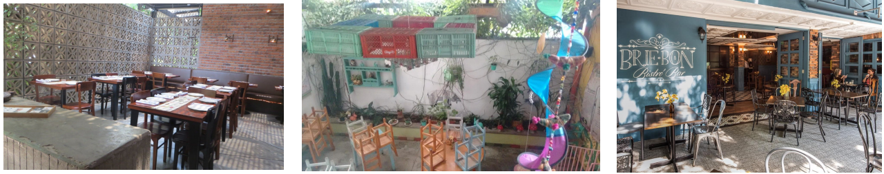
Figura 3. Fotografías casos de estudio principales. De izquierda a derecha: Ocio, Verdeo y Brie Bon.

encuentra ubicado dentro del sector Provenza, pero el contacto con el arquitecto interventor brindó información pertinente sobre este tipo de transformaciones (Ver figura 3).