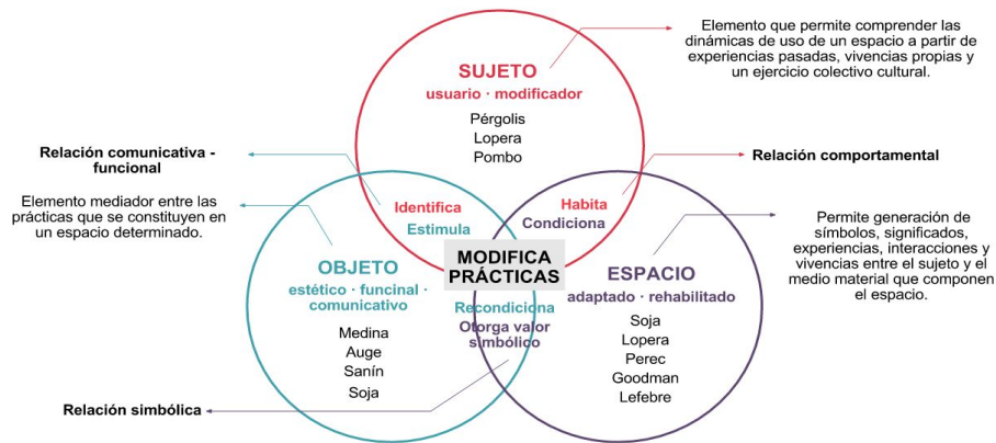
Figura 1: Estructura del marco conceptual (Esquema realizado por las investigadoras).

El esquema de esta investigación propone una relación triádica que consiste en el cruce de un sujeto, un sistema objetual y el espacio que los contiene, y como punto de encuentro entre estos tres elementos, se ubica la modificación de unas prácticas que terminan por conformar las identidades colectivas que se construyen a partir de relaciones materiales e inmateriales. (Ver figura 1).