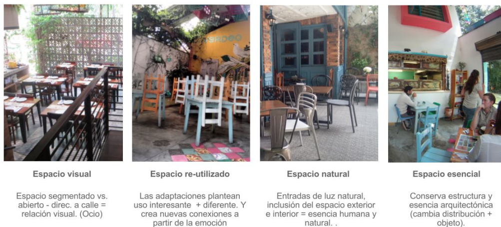
Figura 6. Hallazgos de los espacios (Fotografías tomadas por las investigadoras)

Las casas de Provenza, desde su arquitectura de varios pisos en desniveles, gran espacio en la parte frontal y la compañía de vegetación en todo el barrio, se han convertido en escenarios, antes llenos de afectos domésticos y ahora repletos de ideales económicos que resignifican por completo su uso y su valor simbólico. Se comprueba entonces desde la propuesta de Edward Soja, que el espacio es una construcción social, que se da más por las relaciones que se establecen dentro de este, que desde su arquitectura como tal. El espacio, entonces, es un lienzo en blanco que soporta todos los afectos e imaginarios que en él se quieran poner, haciéndolo flexible y permitiendo la constante transformación de prácticas, sin dejar nunca de tener la estructura física de una casa (Ver figura 6). Por eso es posible, que este barrio se llene de tantos locales pequeños que re-utilizan de maneras muy variadas estas estructuras, y que aun así siga funcionando como una alternativa dentro de la oferta turística de la ciudad, pues la vegetación y el trazado de barrio tradicional, lo diferencian de otros sectores turísticos de la ciudad que se destacan por las grandes edificaciones.