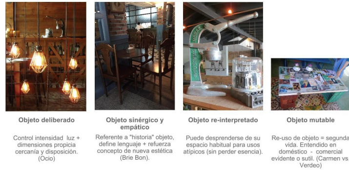
Figura 7. Hallazgos de los objetos (Fotografías tomadas por las investigadoras)