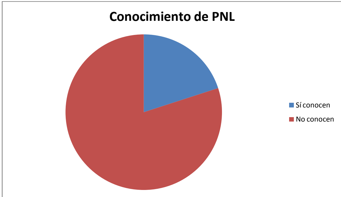
Gráfica 2. Conocimiento de PNL

Con base en las entrevista, se puede concluir que existe un desconocimiento de la temática en el 90% de los entrevistados.