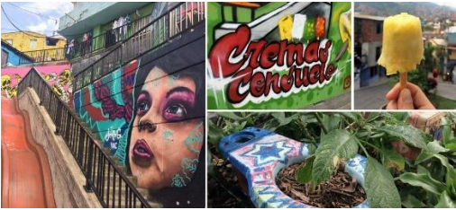
Figura 4 Graffiti Tour.