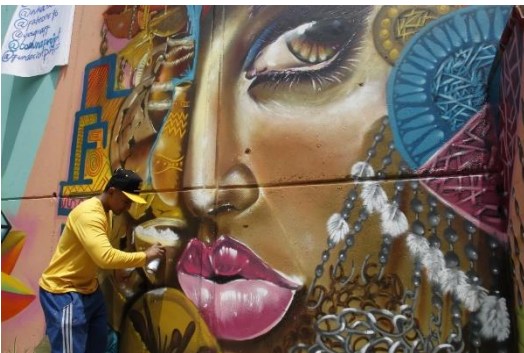
Figura 7 El graffit más grande hecho en la comuna. Recuperada del sitio https://www.eltiempo.com/colombia/medellin/el-grafiti-mas-grande-hecho-en-la-comuna-13-de-medellin-363852 .