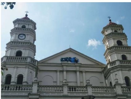
Figura 1 Iglesia de Gertrudis.