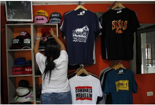
Ilustración 6 El experimento del turismo comunitario.