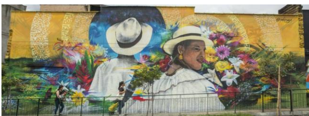
Figura 2 Murales de envigado.

Como puede verse la transformación de la comuna puede verse a través de las diferentes actividades que se realizan, además de los emprendimientos que han hecho que los habitantes de la comuna tengan empoderamiento y creatividad para reavivar el territorio, para configurarlo como un espacio de paz y esperanza en el que se habita y se vive, además de promover el turismo y la diversión. Todos esto puede verse a través de las transformaciones del espacio físico, las emergencias de colectivos de arte y la transformación de las actividades culturales que se realizan para invitar al encuentro y a la participación.