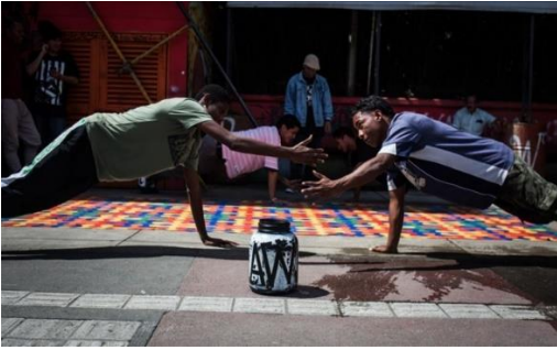
Figura 3 Emprendedores creativos en las comunas de Medellín.