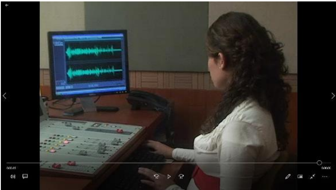
Cabina de radio Estación V