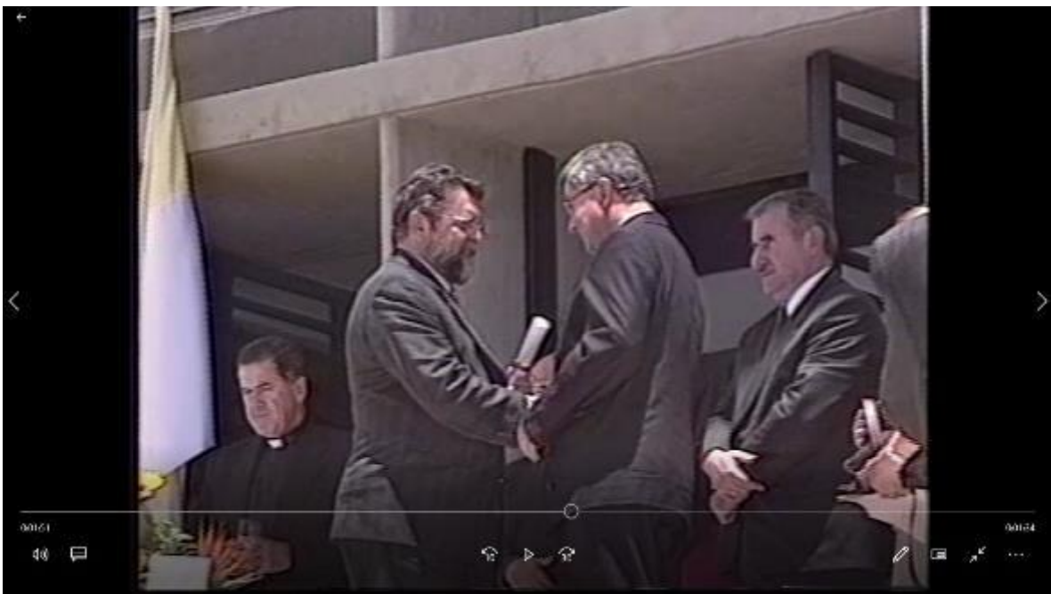
Inauguración Edificio D