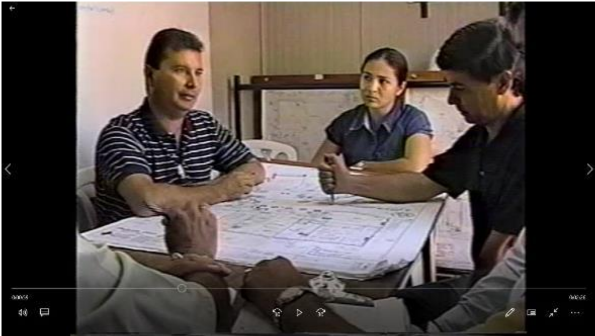
Inauguración Edificio D