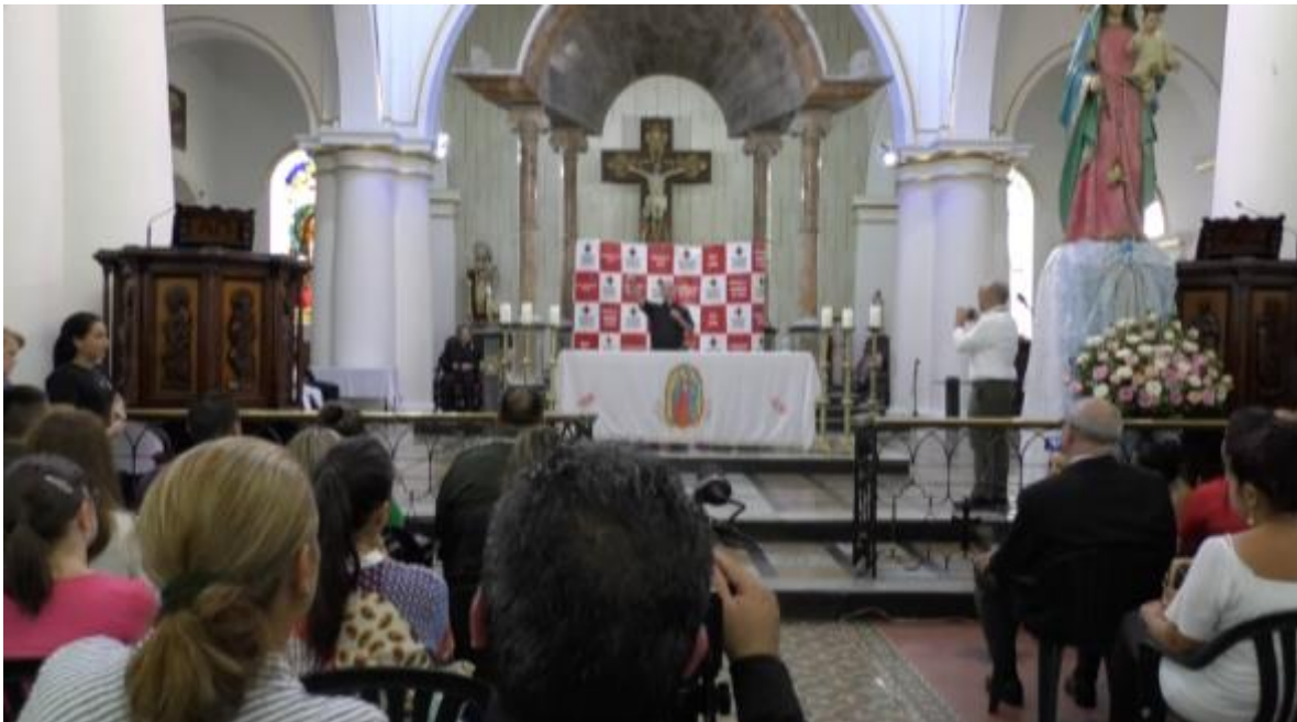
Catedral de la Sagrada Familia