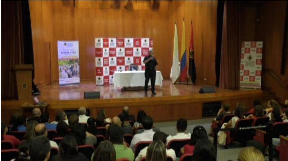
Charla Auditorio Juan Pablo II UPB