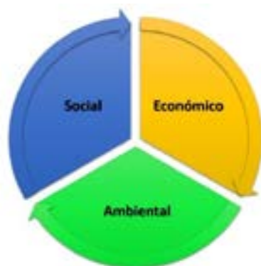
Imagen 1. Tradicional gráfica de la sostenibilidad (ambiente, sociedad, economía) - Autor: elaboración propia, a partir del concepto de la Triple Línea Base.

Luego de más de cuatro años enseñando sostenibilidad en diseño y en proyectos, con la Triple Línea Base de la Sostenibilidad, se concluye: