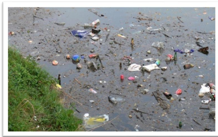
Figura 2. Contaminación del agua.

Cada informe tiene su respectiva ficha técnica, se encuentra en formato DVD y tiene un menú que permite acceder fácilmente a los temas que pueden ser vistos a preferencia del espectador. Se produjo cuatro informes clasificados en las siguientes categorías: