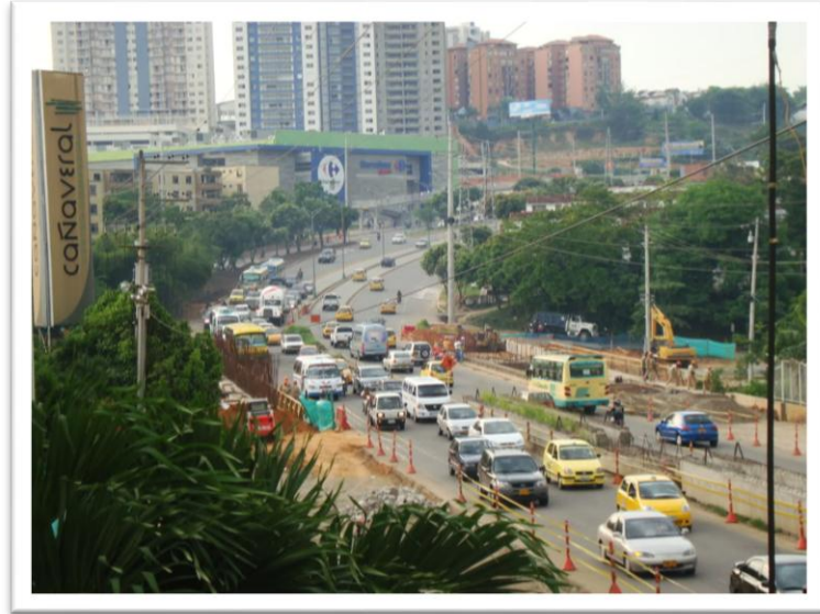
Figura 3. Contaminación del aire.

asuma un papel activo en la lucha por la limpieza y el cuidado de nuestros ríos, quebradas, ciénagas, lagunas y demás fuentes.