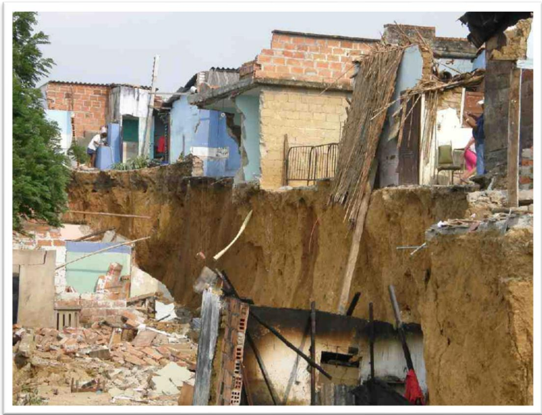
Figura 4. Erosión.

http://bersoabumanga.blogspot.com/2010/04/clopad-en-alerta-amarilla-ante.html