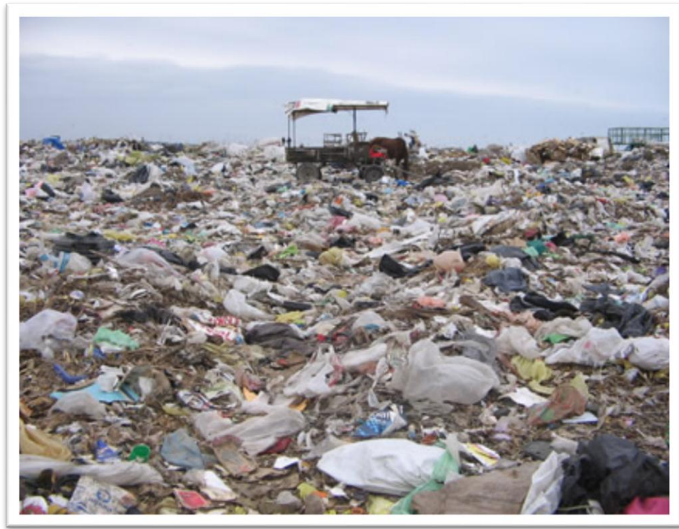
Figura 5. Tratamiento de basuras en Bucaramanga.

http://www.definicionabc.com/wp-content/uploads/erosion2.jpg