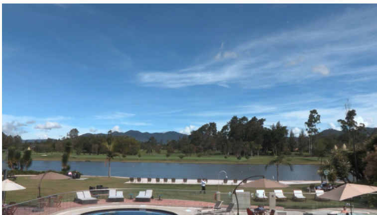
Figura 4: Fotograma Las Razones del lobo (2020).

En este proceso, convergen la intuición y la intención. La primera tiene la capacidad de relacionar una cosa con otra de manera casi inconsciente, en este caso imágenes y recuerdos; el método es más rizomático, pues esa realidad del país, que es objetiva, se relaciona con unas imágenes del inconsciente que tienen que ver con recuerdos de la infancia que son épicos, laberínticos y que no tienen un orden, espacio o tiempo ni son coherentes. Si otra persona quisiera contar esa misma experiencia, serían historias totalmente distintas, y la razón es que no se trata de buscar algo a ciencia cierta, sino de averiguar la huella de los eventos particulares, independientemente de cómo sean exactamente. La intención tiene