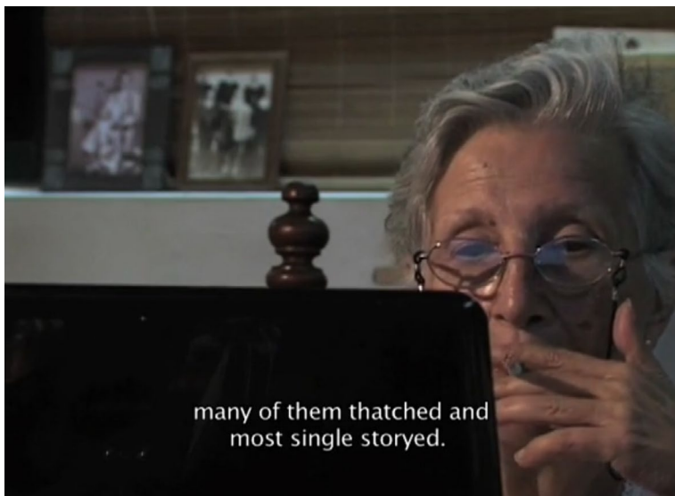
Figura 2: Fotograma Los Demonios Suelos (2010)

manera, la construcción conjunta de las ideas amerita la inclusión de la directora como coautora del texto, pues no solo se trató de extraer información para el análisis, sino también de construir una reflexión sobre el proceso. Así mismo, trabajamos con archivos personales, con literatura gris y también consultamos materiales hemerográficos sobre la película. La pregunta que guio la investigación y la reflexión fue: ¿cómo se conjugan las ideas con el lenguaje cinematográfico?; o, en otras palabras: ¿cómo se construye la mirada del cineasta sobre la realidad? Adicionalmente, tuvo interés particular en la relación entre el relato familiar y la manera como este dialoga con la tradición documental 4 .